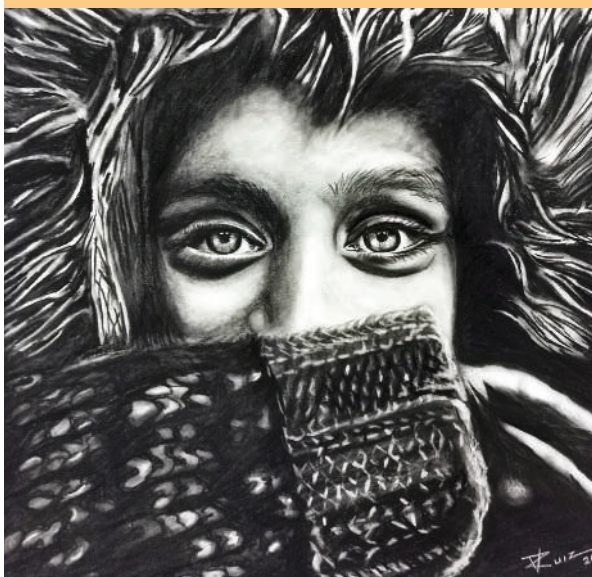
Obra de Vicente Ruiz Deza.

Su formación artística pasa por el conocido Estudio Cañada, así como en diversos talleres de renombrados artistas en el ámbito nacional. La exposición se divide en series, todas ellas con un marcado acento figurativo y realista. Tal es el impacto de su obra que una parte de ella ha sido seleccionada en diferentes certámenes artísticos, publicaciones especializadas en arte del ámbito nacional e internacional y es objeto de colección en galerías de arte especializadas y de coleccionistas privados.