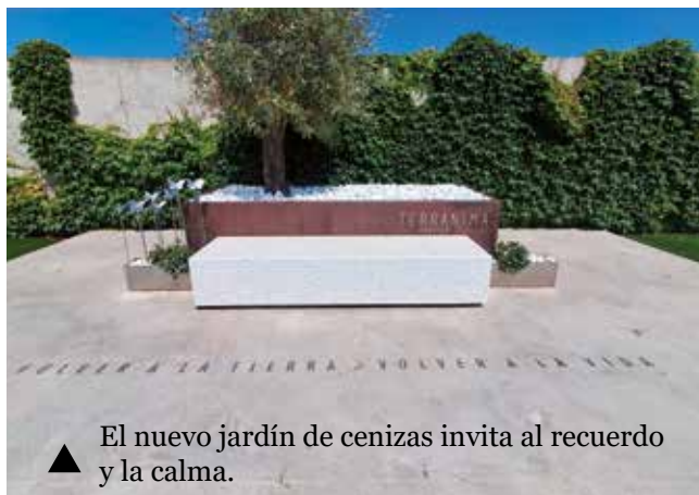
▲ El nuevo jardín de cenizas invita al recuerdo y la calma.

Por otro lado, se ha creado un nuevo jardín de cenizas en el complejo funerario, pensado como un espacio de recogimiento y memoria. Este entorno está formado por tres zonas: un área para el esparcimiento de cenizas, que puede culminar con la plantación de un árbol como símbolo de vida; una plaza central y un espacio de recorridos peatonales que invita a pasear y recordar en calma. Una iniciativa sensible y respetuosa que combina sostenibilidad, naturaleza y memoria colectiva.