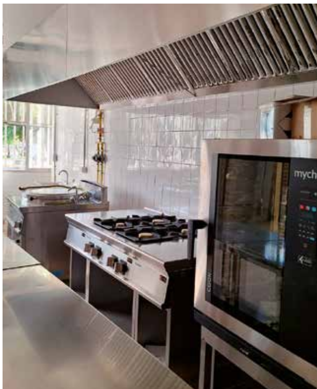
▲ El C.E.I.P. Miguel Ángel Artazos estrena cocina propia.

versión de 295.000 euros que permitirá elaborar menús in situ para más de 180 escolares al día. Además, la sanidad dará un salto con el futuro Centro de Salud en el Parque Europa: 2.300 m 2 , 8 millones de inversión y unas obras que arrancarán en 2026 con un plazo de 20 meses. Tres proyectos que reflejan la buena sintonía institucional y el compromiso compartido con el presente y futuro de Utebo.