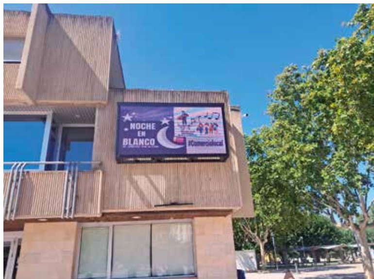
▲ La pantalla del Ayuntamiento ofrece información de servicio.