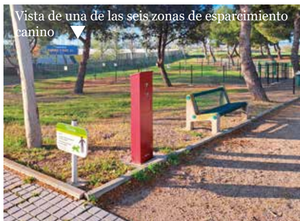
Vista de una de las seis zonas de esparcimiento canino ▼