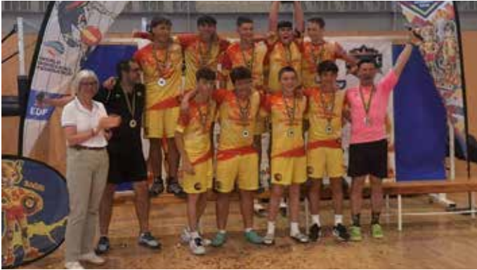
▲ La alcaldesa de Utebo con uno de los equipos españoles de dodgeball.

A finales de agosto, Utebo se convirtió en la capital europea del dodgeball al acoger el primer Campeonato de Europa Junior de este deporte en auge, similar al balón prisionero. No es casualidad: nuestra localidad lleva casi 20 años impulsando su práctica a través del datchball, disciplina nacida en Aragón que ha servido de base para el desarrollo del dodgeball en España. La Federación Aragonesa de Datchball ha sido precursora de la Asociación Española de Dodgeball, clave para que este campeonato fuera una realidad.