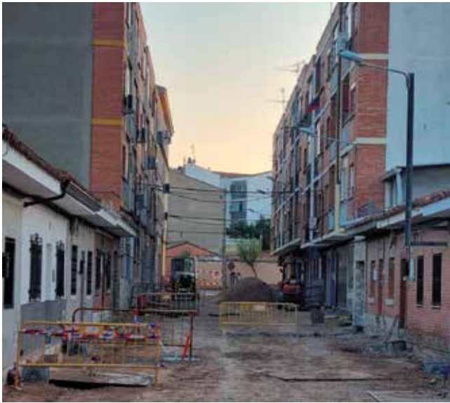
▲ Las obras en la Calle San Francisco mejorarán su accesibilidad.

a 273.919 euros en el caso de San Francisco y 261.240 euros en San Lamberto. Un esfuerzo que no solo mejorará la movilidad, sino también permite renovar infraestructuras básicas: la red de saneamiento y abastecimiento de agua potable, la iluminación pública y la instalación de una red separativa de aguas pluviales. A ello se suman nuevas señales, mobiliario urbano y la canalización de los servicios de telecomunicaciones.