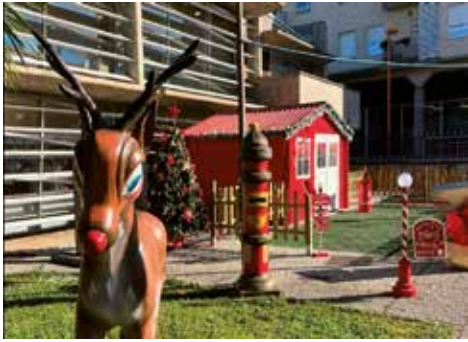
▲ La aldea de Papá Noel encanta a los niños y mayores!