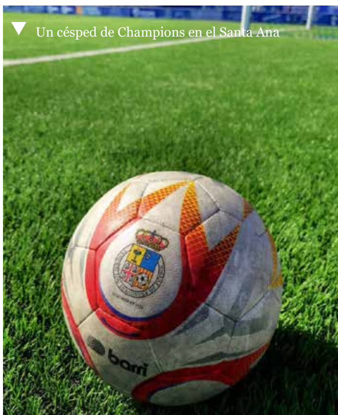
▼ Un césped de Champions en el Santa Ana