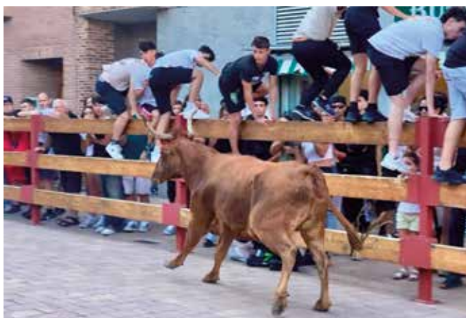
▲ ¡Las vacas han vuelto a la Avenida Zaragoza!

años sin celebrarse. Además, en San Lamberto 2024 se estrenó una nueva zona de peñistas junto a la discomóvil, con 32 jaimas que ofrecen más espacio y comodidad. Una apuesta por mantener vivas las tradiciones al tiempo que se da respuesta a las necesidades de la juventud utebera.