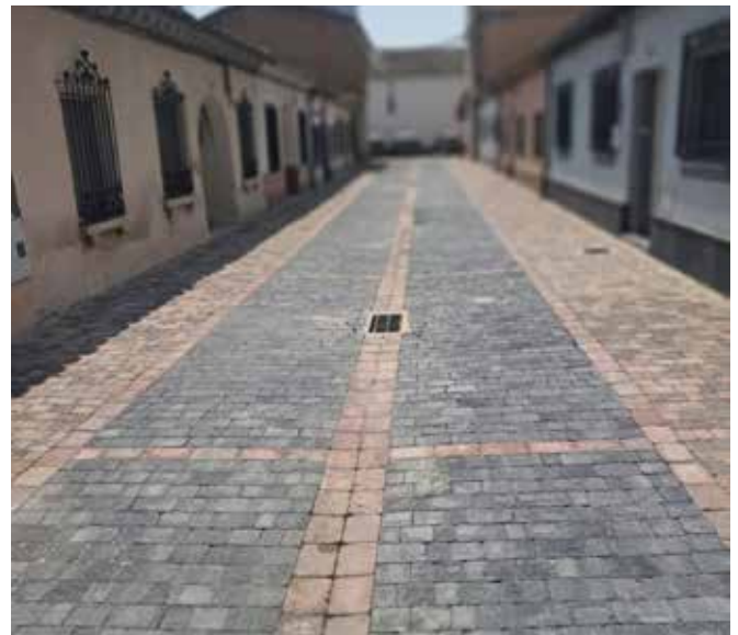
▲ La renovada calle Los Arcos