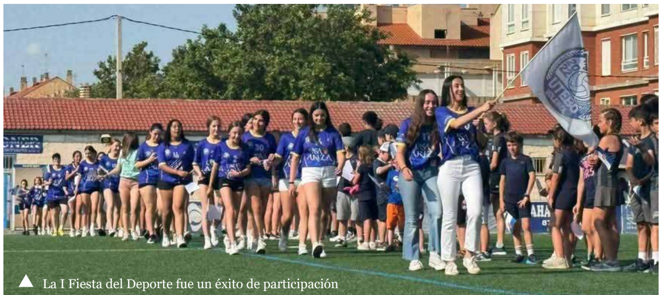
▲ La I Fiesta del Deporte fue un éxito de participación