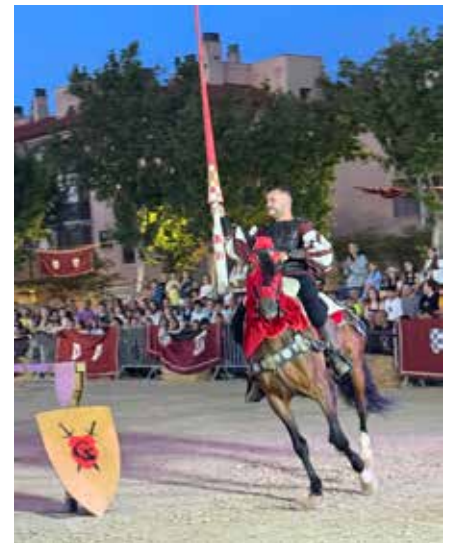
▲ Las Justas fueron la gran novedad de la Feria Mudéjar 2025.

Además, la Feria Mudéjar , declarada Fiesta de Interés Turístico en Aragón, ha crecido hasta superar las 200 actividades en 2025, con exhibiciones de arqueros, torneos de justas, talleres, animación en la calle, recreaciones y visitas guiadas que acercan a vecinos y visitantes a nuestra historia y cultura.