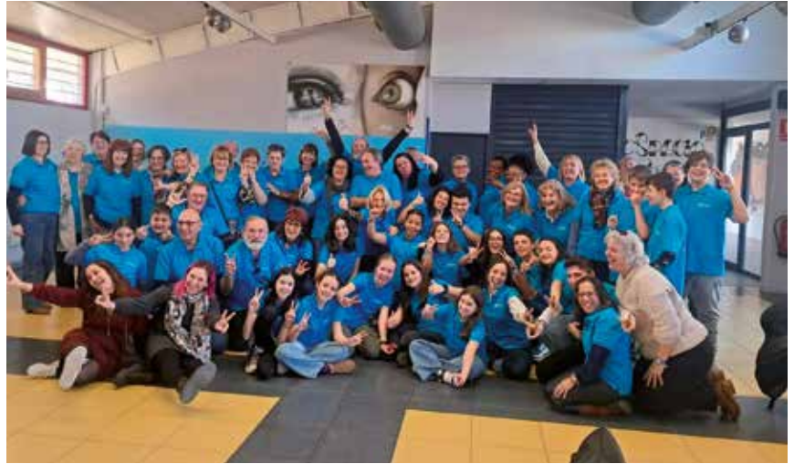
▲ El Espacio Joven celebró su 30 aniversario con un emotivo evento.

cio de asesoramiento afectivo-sexual, el Foro Joven o los campamentos de verano para mayores de 16 años, que este año incluyeron la experiencia única de recorrer el Camino de Santiago.