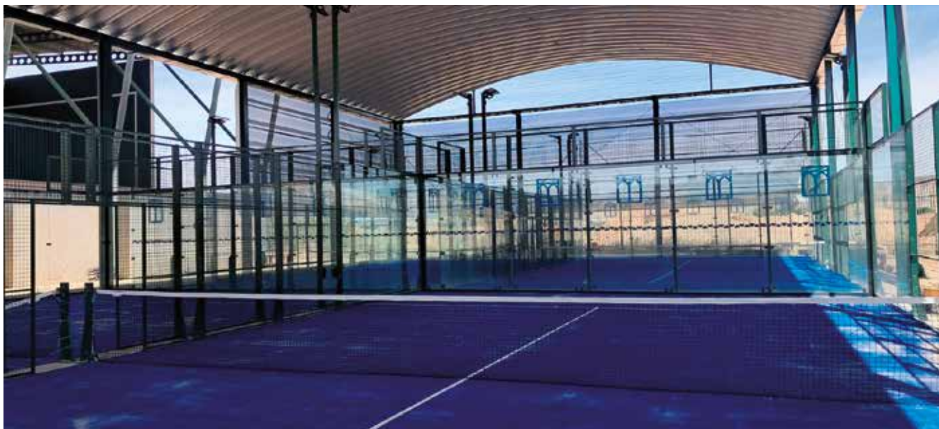
▲ Las dos nuevas pistas de pádel cubiertas permiten disfrutar más de este deporte