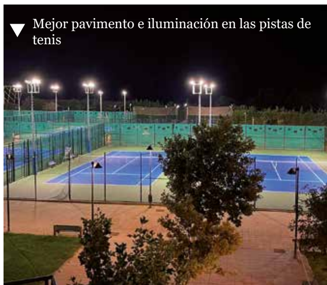
▼ Mejor pavimento e iluminación en las pistas de tenis