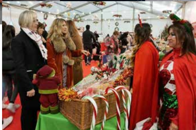
▲ La feria “El comercio brilla por Navidad” se ha convertido en una cita navideña imprescindible.

La Feria de Navidad “El comercio brilla por Navidad” , puesta en marcha en 2023, se ha consolidado como un escaparate festivo para mostrar la riqueza y diversidad del comercio local. Además de los stands, la feria se completa con música, actividades para todos los públicos y la entrega de premios del Concurso