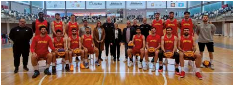
▲ Por Utebo han pasado los distintos combinados nacionales de basket 3x3

de selecciones nacionales en la localidad, con entrenamientos y torneos internacionales.