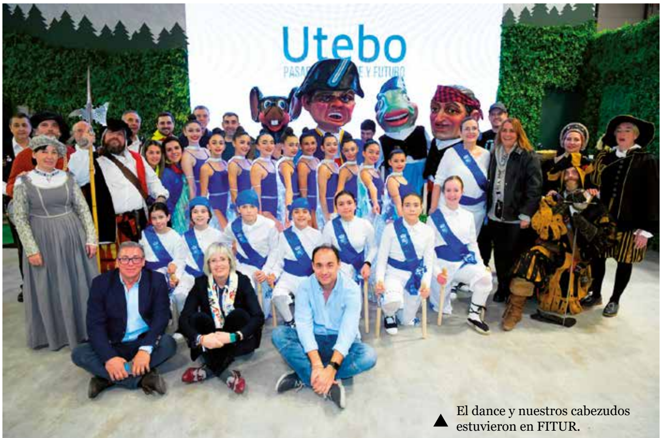
▲ El dance y nuestros cabezudos estuvieron en FITUR.