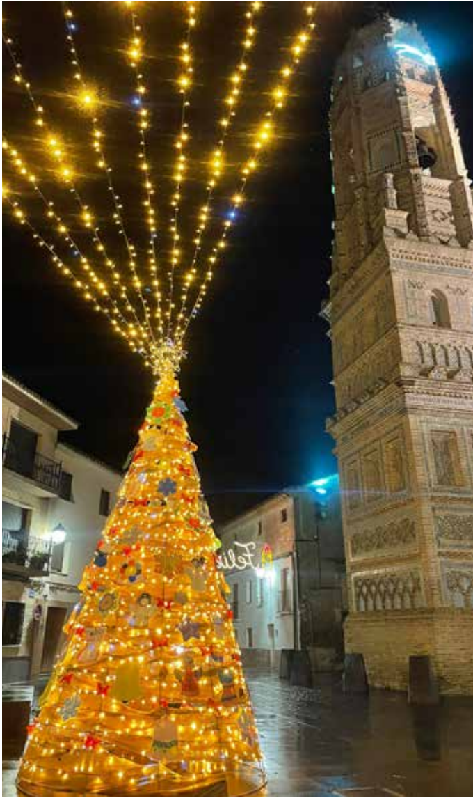
▲ Utebo brilla por Navidad