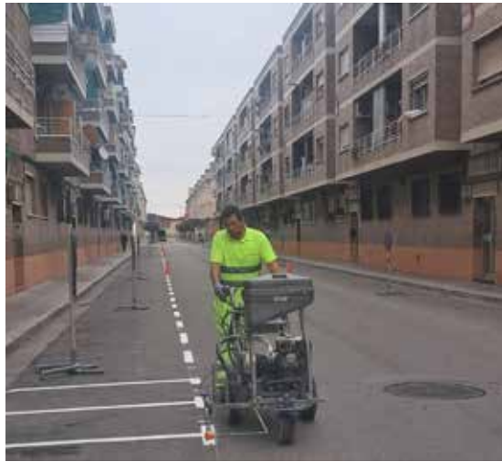
▲ Mayor seguridad vial en Malpica

Uno de los hitos más destacados ha sido la instalación de más de mil placas solares en tres edificios municipales: el Pabellón Las Fuentes, el Espacio Joven y el Edificio Polifuncional. Gracias a la subvención de la Diputación Provincial de Zaragoza dentro del Plan de Infraestructuras Energéticas para Autoconsumo,