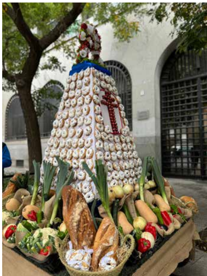
▲ El original manto de rosquillas en la Ofrenda de los Frutos

La cultura en Utebo también se vive en la calle. La iluminación navideña convirtió el municipio en un escenario mágico en 2024, con la bola gigante y el Árbol de la Plaza Constitución, el Bosque Navideño de la Participación y el Árbol de Malpica como protagonistas. Ese espíritu participativo se vio igualmente en la Ofrenda de Frutos del Pilar de los años 2023 y 2024, donde Utebo estuvo presente con un original manto de rosquillas y cestas de productos locales que se donaron a entidades sociales. Las propuestas culturales han sido tan variadas como enriquecedoras: cine de verano gratuito en El Molino y en el María Moliner, el nacimiento de los Reconocimientos San Jorge para premiar el talento artístico local, la exitosa primera edición del Encuentro de Villancicos con 500 participantes, o el impulso al dance de Utebo, que viajó a FITUR y estuvo en la Feria Mudéjar para mostrar al mundo esta tradición centenaria.