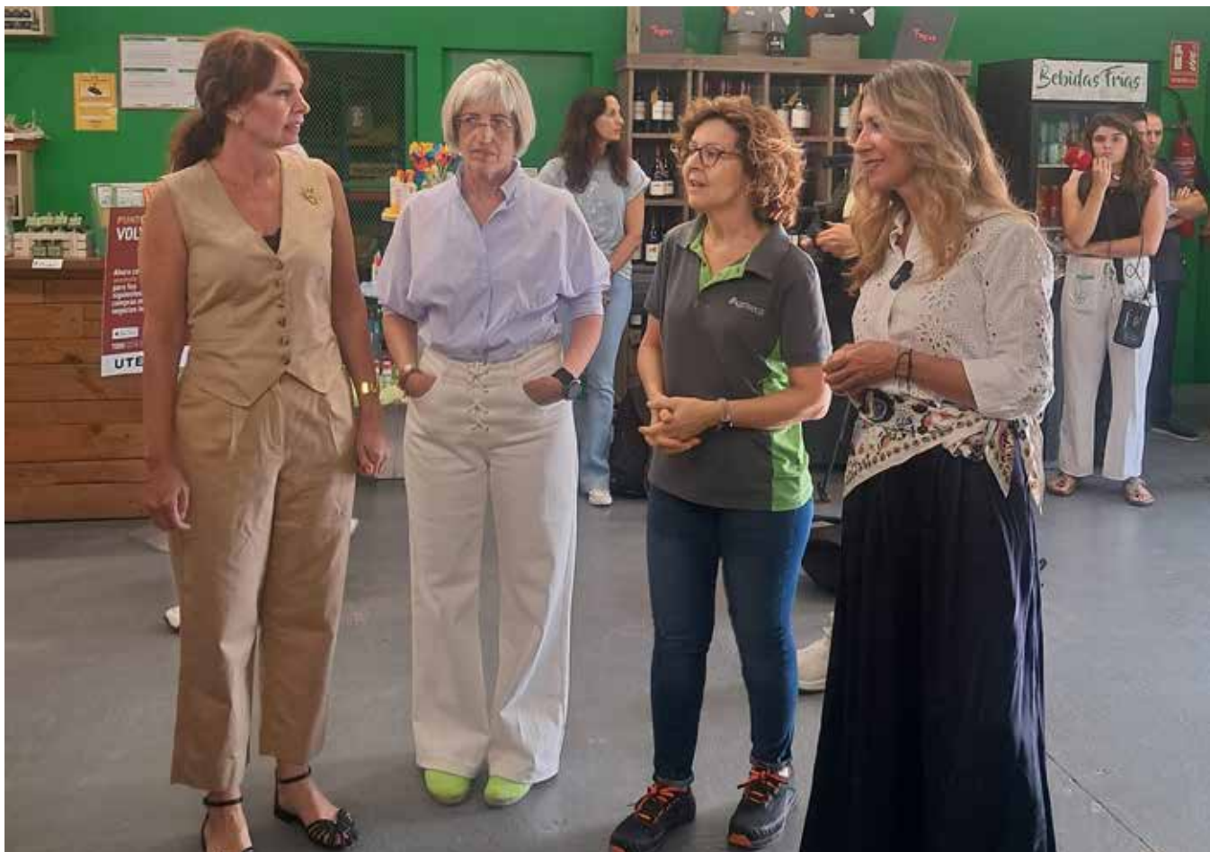
▲ El programa Volveremos es un éxito en Utebo.