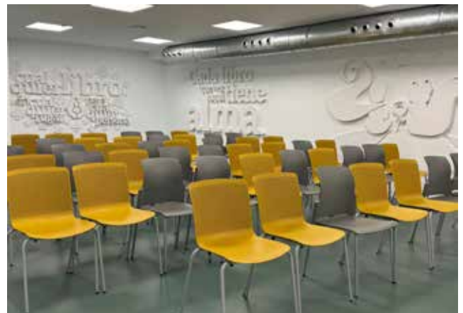
▲ Salón de actos en el sótano de la Biblioteca