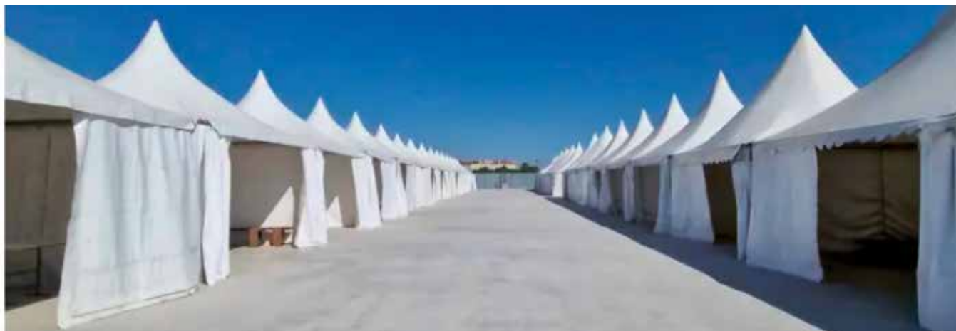
▲ Las jaimas de los peñistas tienen ahora más espacio.