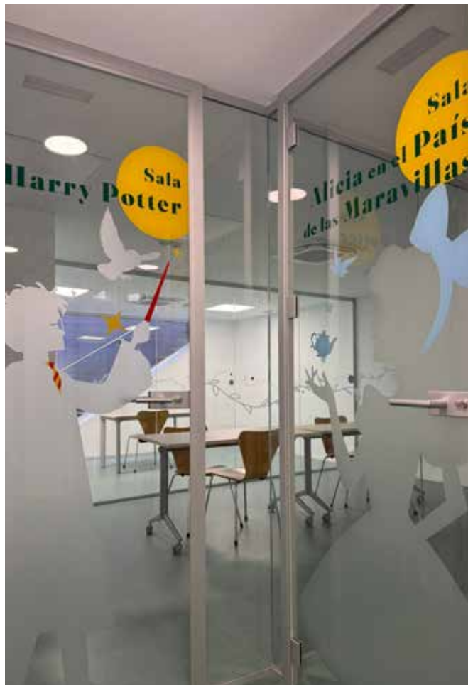
▲ Una de las nuevas salas en el sótano de la Biblioteca

Uno de los grandes avances ha sido la creación de la nueva Sala de Estudio junto a la Biblioteca Municipal, un espacio muy esperado por los estudiantes de Bachillerato, FP y Universidad que ya cuentan con un lugar adaptado para preparar sus exámenes en un entorno adecuado. A ello se suma la reforma integral del sótano de la Biblioteca , que tras una inversión de más de 230.000 euros ofrece ahora un moderno salón de actos y cuatro salas polivalentes donde tienen cabida actividades culturales de todo tipo.