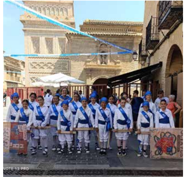
▲ Pasión por el dance en las nuevas generaciones