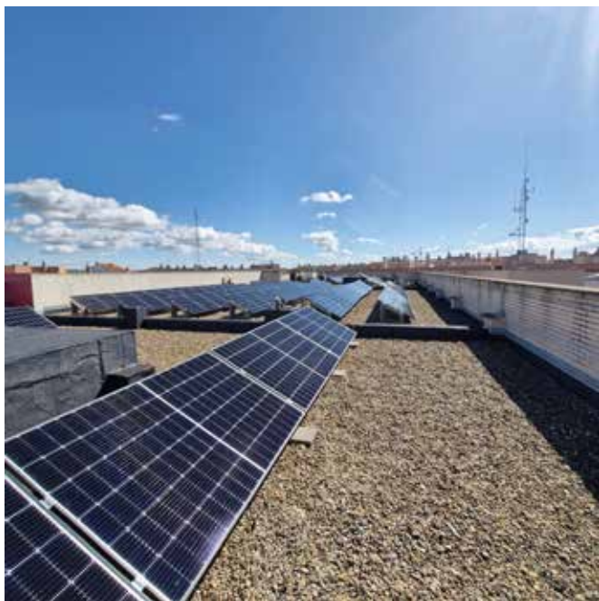
▲ Plazas solares en la azotea del Edificio Polifuncional

El área de urbanismo del Ayuntamiento ha impulsado numerosas actuaciones que, además de mejorar la calidad de vida, refuerzan el compromiso con la eficiencia energética, la movilidad segura y la accesibilidad.