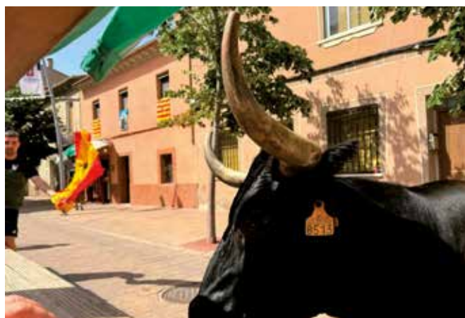
▲ La suelta de vacas es un acto muy esperados.