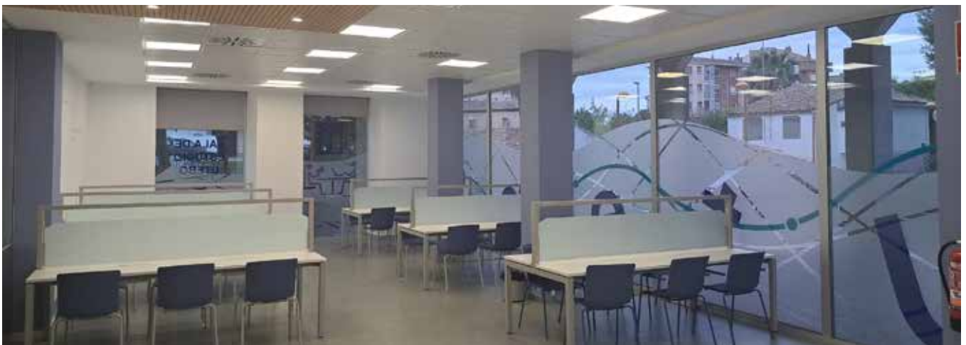
▲ Nueva sala de estudio

La programación ha incluido también visitas culturales a espacios emblemáticos de Zaragoza.