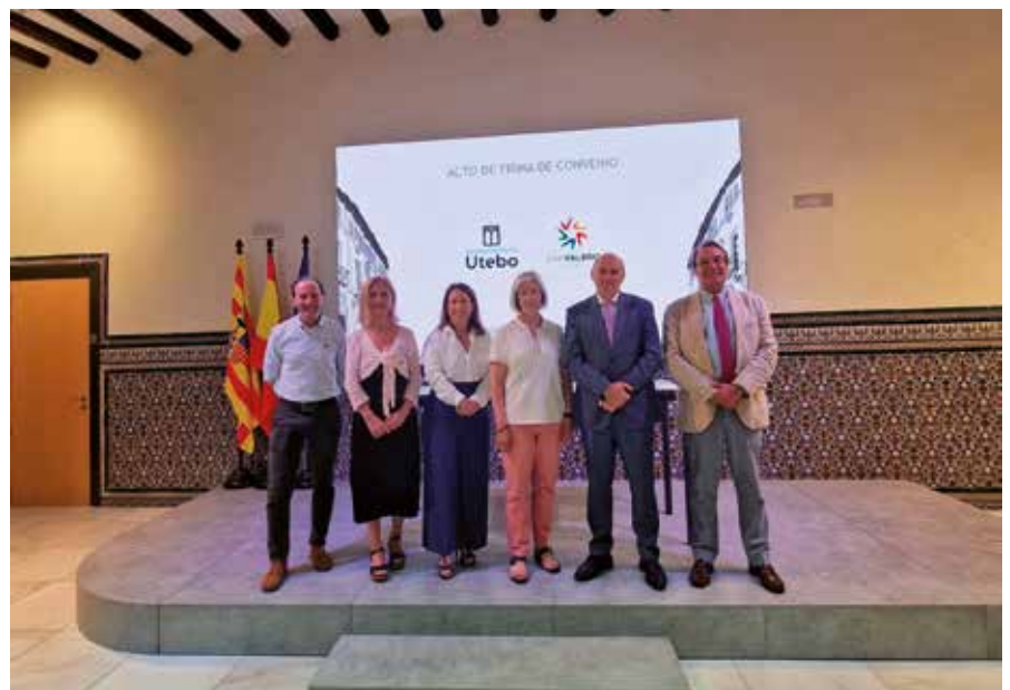
▲ El convenio con el Grupo San Valero permite colaborar en materia de cualificación profesional y fomento del empleo.

El Ayuntamiento de Utebo refuerza su compromiso con el empleo y el emprendimiento con acciones que generan oportunidades para vecinos y empresas. Un ejemplo fue el Foro UCE24 , consolidado como espacio de encuentro entre demandantes de empleo y compañías locales. La colaboración educativa también es clave: el convenio con el Grupo San Valero impulsa proyectos de inserción y cualificación laboral, mientras que el acuerdo con la Universidad San Jorge ofrece descuentos en másteres a trabajadores y directivos de empresas de Utebo.