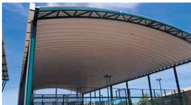
▲ Las cubiertas en las pistas de pádel protegen del sol y el viento

Uno de los proyectos más destacados ha sido la renovación del Campo de Fútbol Santa Ana . Con una inversión de 270.919 euros, el estadio luce ahora un césped homologado con certificación FIFA Quality Pro, la máxima distinción en este tipo de superficies. A ello se suma la fina-