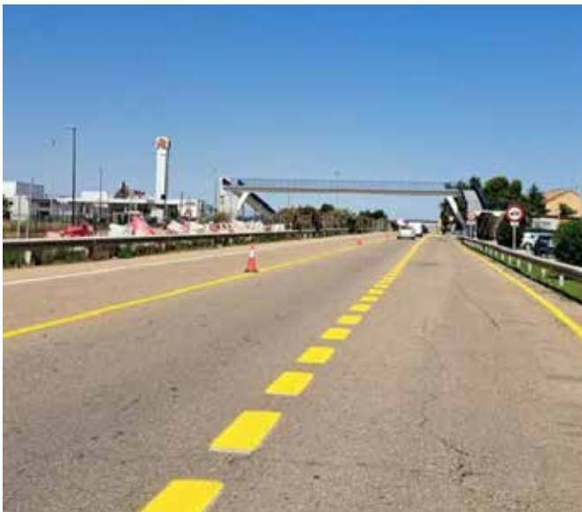
▲ La N-232 a su paso por Utebo

El Teatro Municipal Miguel Fleta ha mejorado su eficiencia energética con la renovación de su instalación térmica, y además se han realizado trabajos de pintura y mantenimiento en los colegios y principales edificios culturales de la localidad.