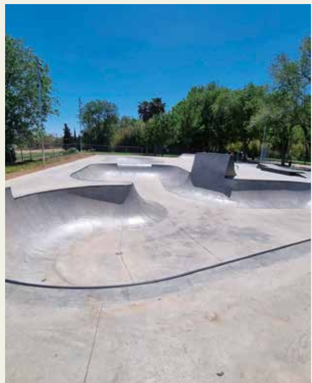
▲ El skate park es por fin una realidad

A demás de nuevos proyectos, el equipo de gobierno de María Jesús Sariñena ha culminado actuaciones iniciadas en mandatos anteriores, ofreciendo resultados tangibles. Destaca el skate park del Parque de Las Fuentes , con 314.540 euros de inversión y diseño de José Javier Labad Cortadi, que integra propuestas locales y permite practicar modalidades street y park en un espacio seguro y moderno. En el ámbito patrimonial, la rehabilitación de la fachada sur de la Iglesia de Santa María , con 200.000 euros de inversión, ha mejorado el Casco Histórico al restaurar la fachada, eliminar un muro y urbanizar la zona con piedra de Calatorao. También se completó la ampliación del centro de salud , que ahora cuenta con 16 consultas y cuatro despachos más tras unas obras valoradas en 450.000 euros, mejorando así la atención sanitaria en Utebo.