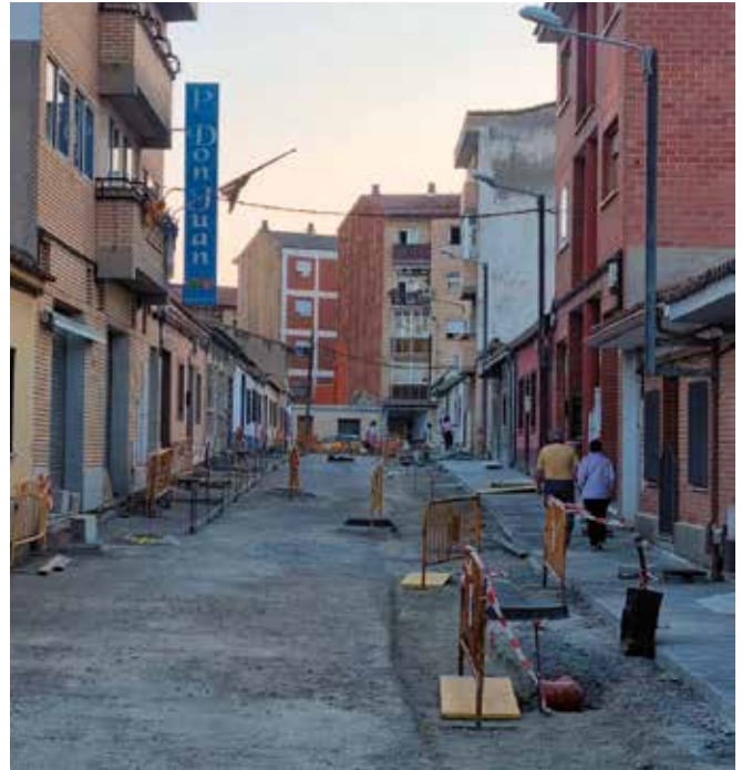
▲ Los trabajos en la Calle San Lamberto renuevan también importantes elementos subterráneos.

Las calles San Francisco y San Lamberto están siendo renovadas para adaptarse a las necesidades reales de los vecinos. Hasta ahora, sus aceras estrechas dificultaban el paso a personas con movilidad reducida, usuarios en silla de ruedas o familias con carritos de bebé. Para solucionarlo, el Ayuntamiento ha apostado por transformarlas en calles de plataforma única, con aceras y calzada al mismo nivel, garantizando así una accesibilidad total y manteniendo las plazas de aparcamiento. La inversión asciende