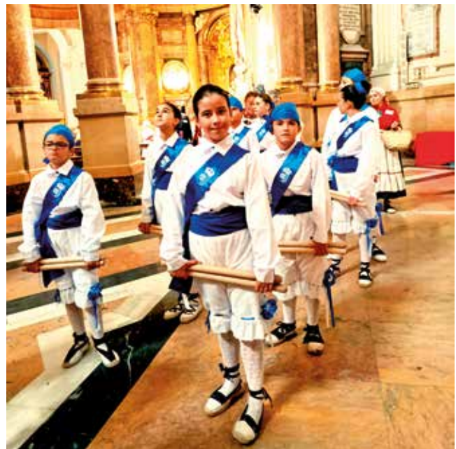
Fotografía: Para mostrar nuestras tradiciones se invitó al CEIP Octavus, que representó el dance.