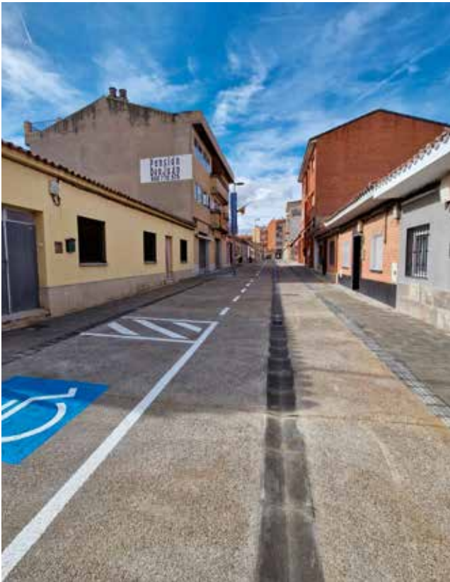
Fotografía: Así luce ahora la calle San Lamberto.

Para él, la diferencia con respecto a antes es “enorme”. “El cambio se nota un montón para bien —cuenta—, y no solo en el aspecto general, sino también en la reforma de las tuberías, que antes daban malos olores cada dos por tres”. Y añade con orgullo: “Todos los vecinos están muy contentos del cambio. Antes teníamos aceras estrechas que hacían difícil el paso y ahora está todo a nivel, así que han desaparecido los problemas de los carritos de bebé y ha mejorado mucho el paso de los peatones”.