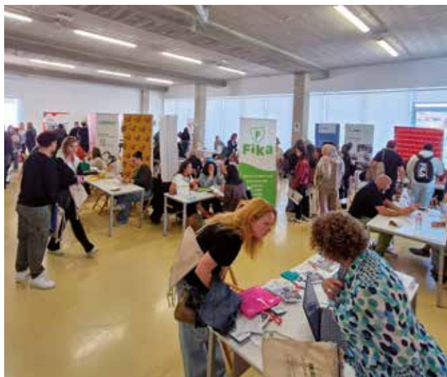
Fotografía: Cientos de personas en busca de empleo y 32 empresas se dieron cita en el Foro UCE25

Durante toda la mañana, las entidades participantes ofrecieron información detallada sobre sus procesos de selección, recogieron currículums y compartieron con los asistentes las oportunidades laborales disponibles. Esta interacción directa permitió a numerosos vecinos conocer de primera mano las necesidades y demandas del mercado laboral actual.