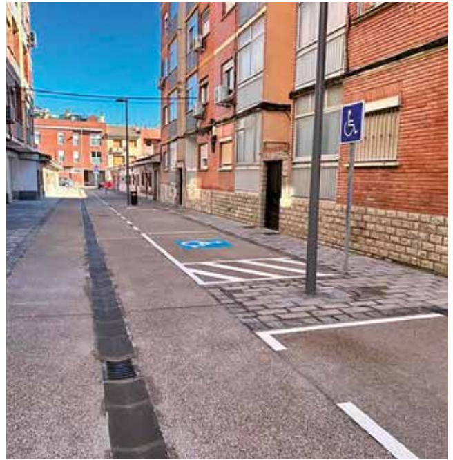
Fotografía: La calle San Francisco ha experimentado una renovación integral.