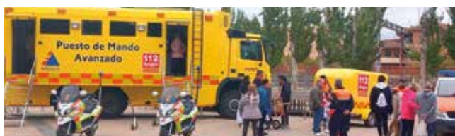
Fotografía: Durante el congreso se desarrollaron varios talleres prácticos.

El Ayuntamiento de Utebo agradece a su Agrupación de Protección Civil la dedicación desinteresada y subraya que este congreso ha supuesto una oportunidad para visibilizar su labor y reforzar sus capacidades.