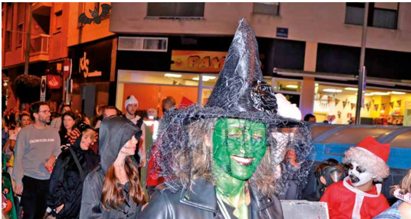
Fotografía: Las brujas salieron a pasear en esta noche terrorífica.