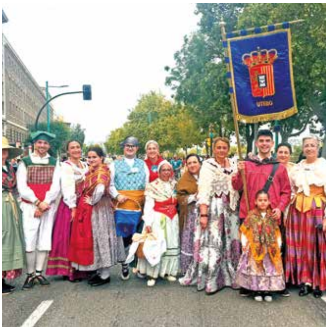
Fotografía: Los uteberos participantes en la Ofrenda de Frutos.