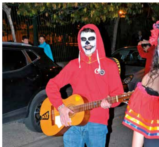
Fotografía: Vimos al joven Miguel de la película Coco.