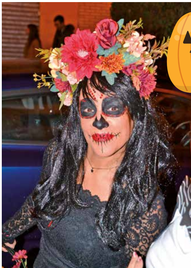
Fotografía: Mujer disfrazada de Catrina mexicana.