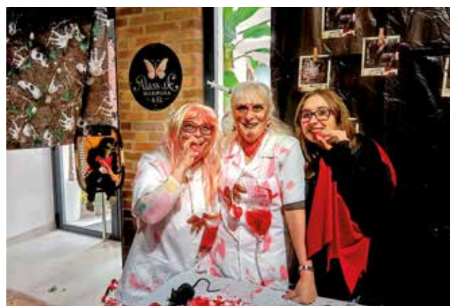
Fotografía: Grandes y pequeños lo pasaron de miedo en Halloween.