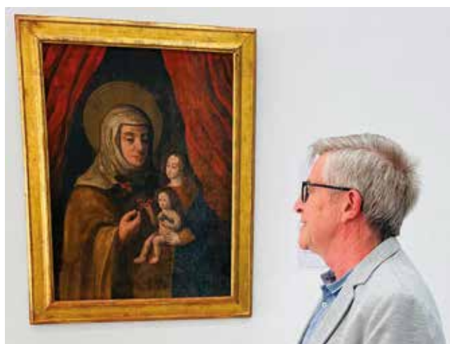
Fotografía: El cuadro ha pasado por un minucioso trabajo de restauración.

El cuadro se puede admirar nuevamente en la iglesia de Nuestra Señora de la Asunción, donde ha regresado tras haber estado expuesto en el Mesonada.