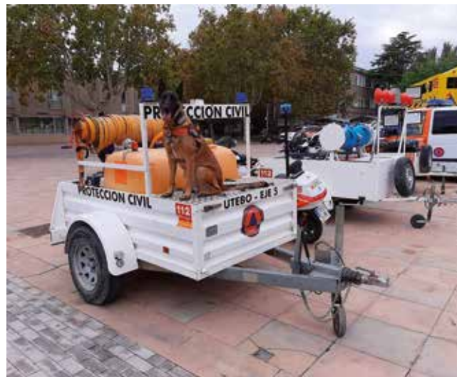
Fotografía: En lo que va de año, los 820 voluntarios han intervenido en un total de 3.105 activaciones.