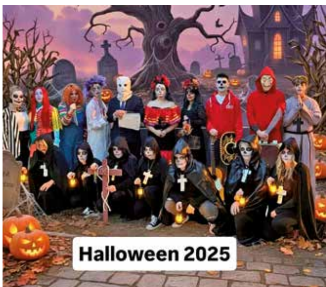
Fotografía: Todos los participantes destacaron por su originalidad