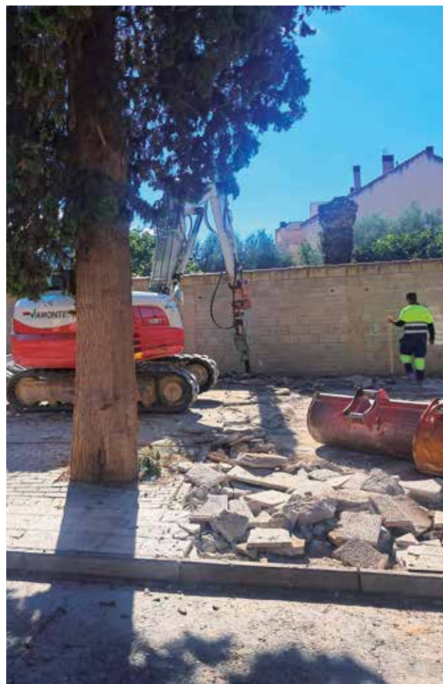
Fotografía: La nueva pavimentación ofrecerá una continuidad estética con la Plaza de España.

Con esta actuación, el Ayuntamiento de Utebo avanza en su objetivo de crear un Casco Histórico más accesible, sostenible y acogedor, que invite al paseo y mejore la calidad de vida de vecinos y visitantes.