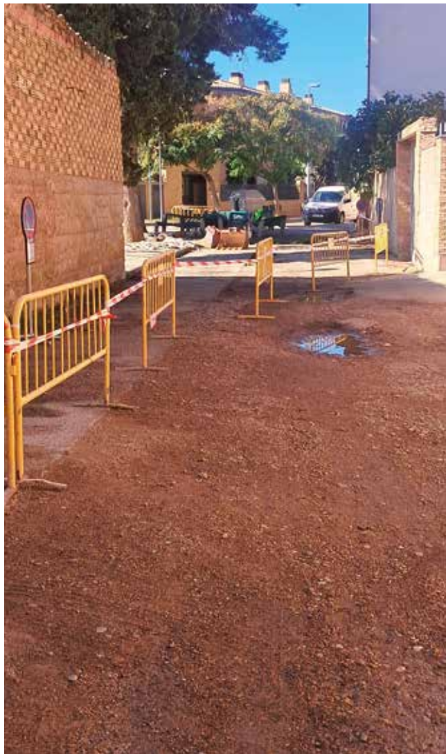
Fotografía: La actuación mantendrá el carácter peatonal prioritario de la vía.

El Ayuntamiento de Utebo ha puesto en marcha las obras de pavimentación de la calle Alberto Casañal, situada en el Casco Histórico del municipio. Esta actuación, muy esperada por los vecinos, forma parte del compromiso municipal por mejorar la accesibilidad, la movilidad y la calidad urbana de los espacios públicos más emblemáticos de la localidad.