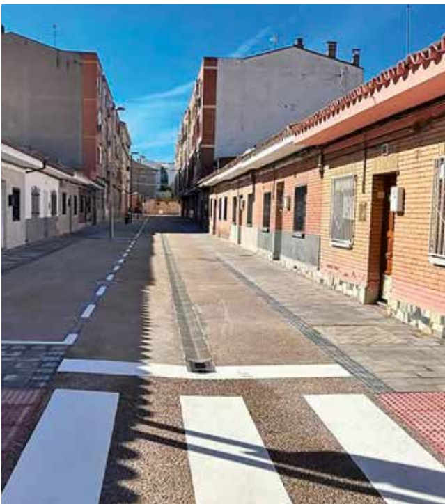
Fotografía: Se ha intentado mantener el máximo espacio de aparcamiento en San Francisco.

Las obras de San Lamberto se han desarrollado durante cuatro meses y han contado con una inversión de más de 261.000 euros. El resultado: una vía de plataforma única, de preferencia peatonal y con un único sentido de circulación, mucho más amplia y accesible. Se ha habilitado un aparcamiento en cordón en uno de sus laterales, con espacio para 17 vehículos y una plaza reservada para personas con movilidad reducida.