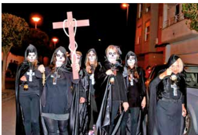
Fotografía: La Santa Compañía desfiló por las calles de Utebo.