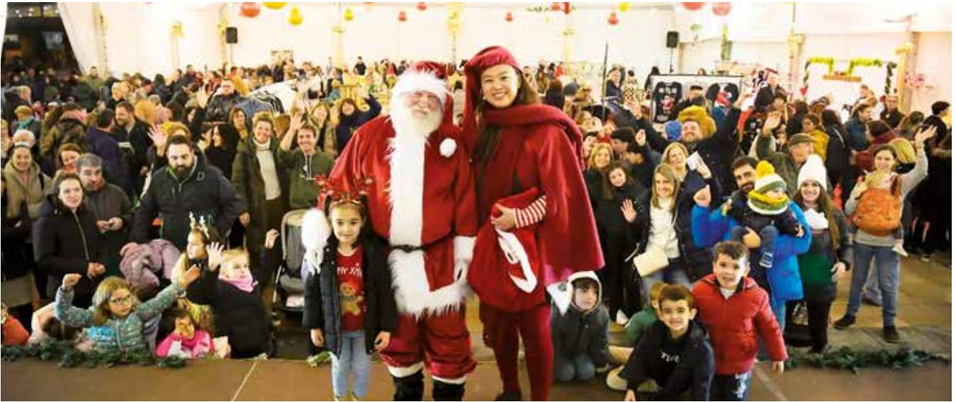
Fotografía: Hasta Papá Noel, con su aldea tan cercana a la feria, no quiso perderse detalle.

Utebo volvió a vivir uno de sus eventos más multitudinarios con la celebración de la Feria de Comercio de Navidad, que tuvo lugar del 12 al 14 de diciembre en la gran carpa instalada en el parque de Santa Ana. La cita, ya consolidada en la programación navideña del municipio, volvió a reunir a vecinos, comerciantes y familias en un ambiente festivo y lleno de propuestas.