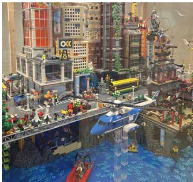
Fotografía: En menos de un mes, más de 4.000 personas han visitado UteboBricks.

Desde el Ayuntamiento se valora de forma muy positiva la respuesta del público, destacando que iniciativas como esta confirman el interés de la ciudadanía por propuestas culturales innovadoras, participativas y accesibles, capaces de convertir una visita en una experiencia memorable. Por eso UteboBricks se ha convertido ya en un referente de ocio cultural en Utebo durante la temporada navideña.