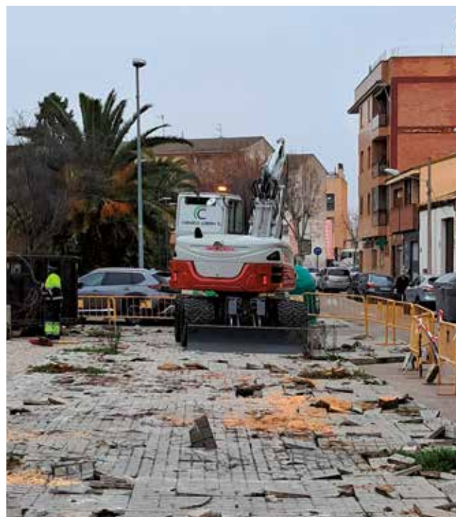
Fotografía: Más plazas de aparcamiento con el cambio de línea a batería.

Con actuaciones como esta, Utebo avanza hacia un modelo de movilidad más cómodo, accesible y sostenible, apostando por soluciones reales a los retos del día a día: más plazas de aparcamiento, espacios mejor ordenados y una ciudad pensada para las personas. Una forma de mejorar la calidad de vida y seguir construyendo un Utebo más funcional y amable.