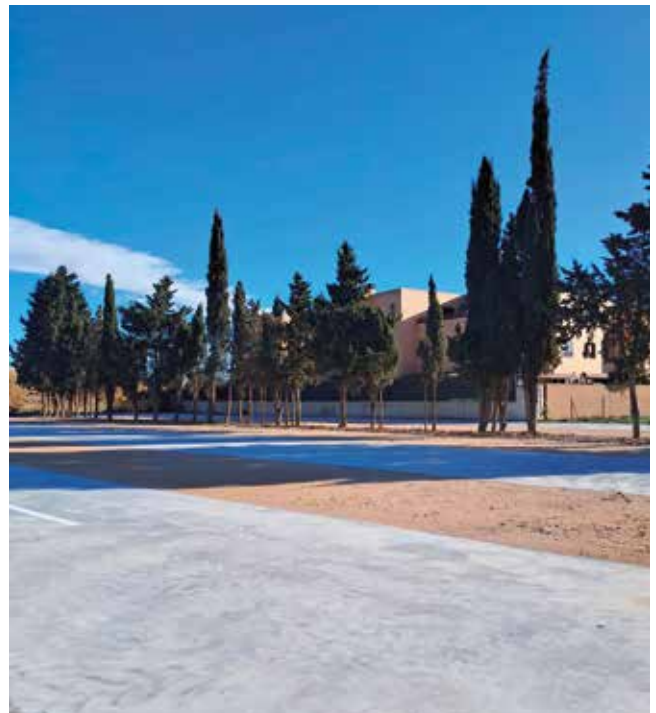
Fotografía: El nuevo parking cuenta con un total de 85 plazas de aparcamiento.

Con la puesta en marcha de este parking disuasorio, Utebo da un nuevo paso en la planificación de sus espacios públicos, apostando por soluciones prácticas que responden a las necesidades reales de la ciudadanía. Una infraestructura que no solo facilitará el día a día de quienes utilizan esta zona, sino que también contribuirá a una ciudad más accesible, segura y bien organizada.