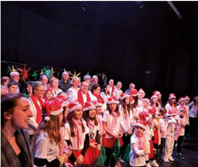
Fotografía: Más de 350 coralistas de distintas edades participaron en el II Encuentro de Villancicos de Utebo.

Utebo volvió a convertirse en un escenario lleno de magia y tradición con la celebración del II Encuentro de Villancicos, un evento que consolidó su éxito reuniendo a más de 350 coralistas de distintas edades y procedencias. Durante tres emocionantes tardes, el público disfrutó de