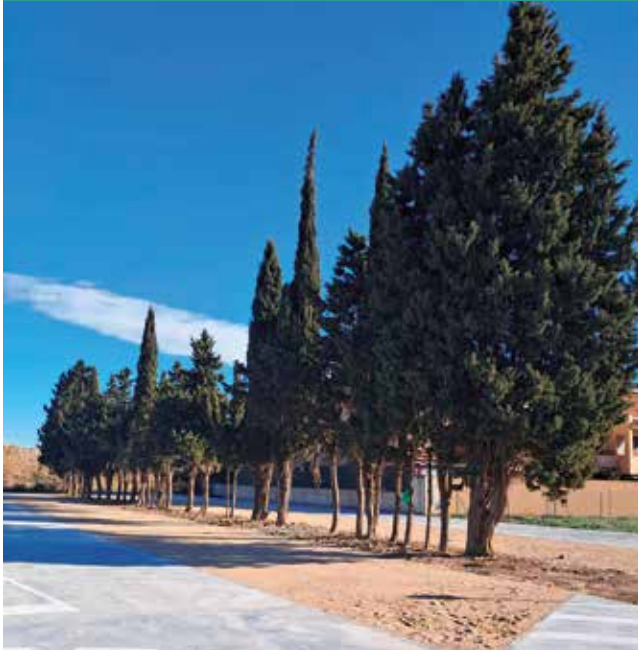
Fotografía: Este aparcamiento responde a una necesidad real de Utebo y mejorará el flujo del tráfico.

El Ayuntamiento de Utebo ha finalizado con éxito las obras del nuevo aparcamiento disuasorio del Camino de la Estación, una infraestructura pensada para mejorar la movilidad y facilitar el estacionamiento en una de las zonas con mayor densidad de tráfico del municipio. La apertura al público se realizará en los próximos días, una vez concluyan los trabajos de instalación del sistema de cámaras de vigilancia, que garantizará la seguridad tanto de los usuarios como de las propias instalaciones.