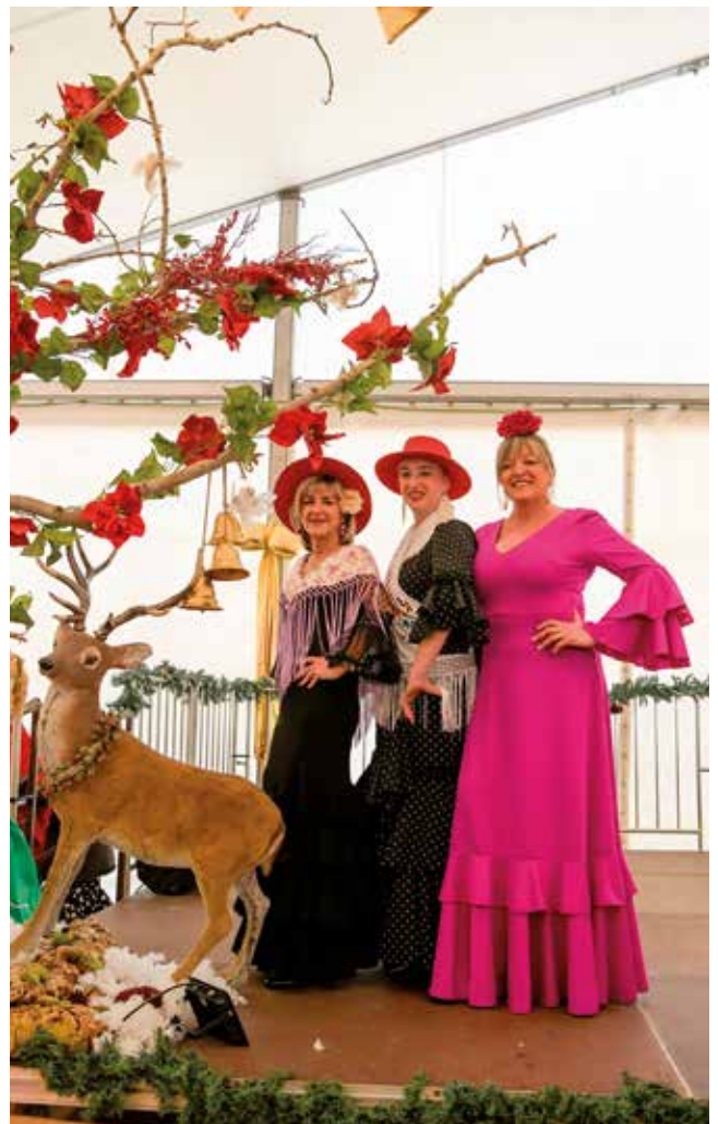
Fotografía: Durante los tres días se celebraron actividades familiares, talleres y actuaciones musicales.