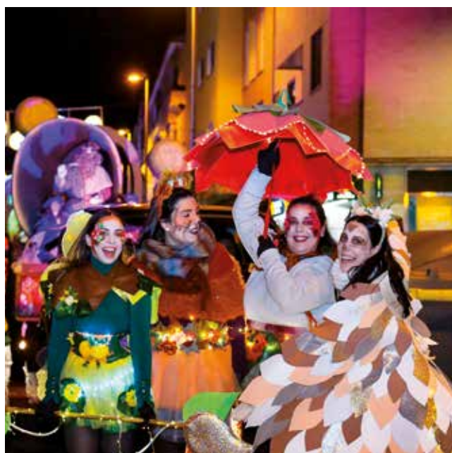
Fotografía: Las hadas, ninfas y otros elementos de la naturaleza guiaron al Rey Gaspar

El desfile avanzó hasta el Reino del Bosque, con hadas, ninfas, árboles invisibles y entrañables animales encantados como erizos, ciervos y conejos que guiaron al Rey Gaspar, representante de la armonía con la naturaleza y la conexión con la tierra.