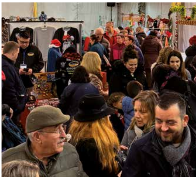
Fotografía: Los vecinos tuvieron oportunidad de conocer la amplia gama de comercio local.

La excelente acogida de esta edición, y el éxito que avala las anteriores, confirma que la Feria de Comercio de Navidad es un referente para la vida comercial y festiva de Utebo.