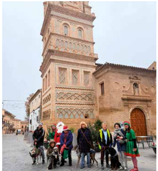
Fotografía: Humanos y peludos hicieron frente al frío bien abrigados.

Desde la organización se agradeció la gran participación y el apoyo recibido, que convirtieron esta primera edición en un evento emotivo y lleno de esperanza.