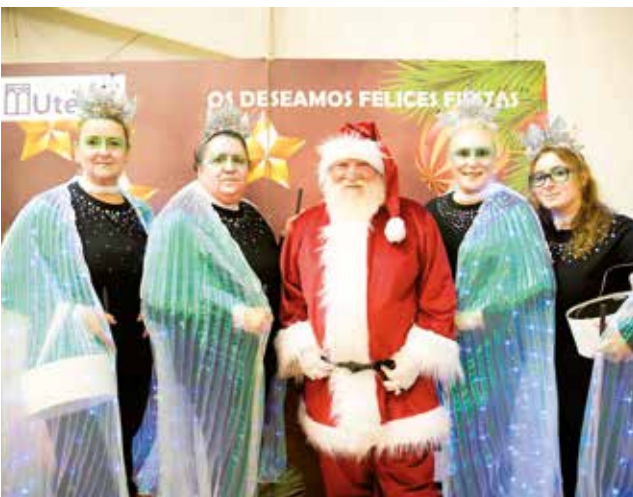
Fotografía: La programación de la feria incluyó actividades para todas las edades

La inauguración oficial, celebrada el viernes 12, contó con la presencia de Carmen Herrarte, directora general de Comercio, Ferias y Artesanía, que acompañó a las autoridades locales en la apertura de un evento que destacó por su diversidad y participación.