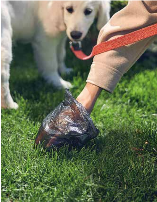
Fotografía: Mantener las calles limpias está en mano de todos.

Tener un animal de compañía es una fuente de alegría, cariño y compañía. Forma parte de muchas familias y de la vida diaria de nuestro municipio. Pero convivir con mascotas también implica asumir una responsabilidad que va más allá del ámbito privado: cuidar el espacio público que compartimos con el resto de vecinos.