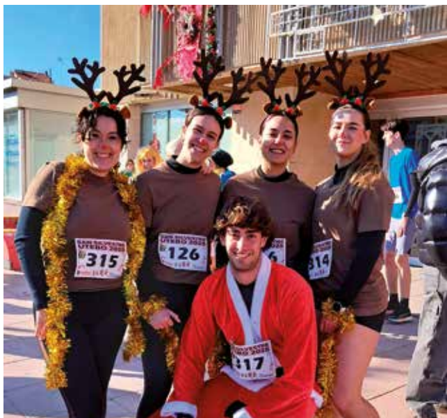
Fotografía: Los disfraces originales siempre presentes en la San Silvestre.

Utebo despidió el año de la mejor manera posible con la celebración de una nueva edición de la San Silvestre Utebera, una cita ya tradicional que volvió a llenar las calles del municipio de deporte, alegría y muy buen ambiente. La carrera, organizada por el Club Octavus Triatlón y patrocinada por el Ayuntamiento de Utebo, reunió a cerca de 400 participantes, consolidándose como una auténtica fiesta popular.