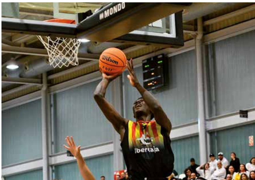
Fotografía: Una vez más, Utebo se convierte en uno de los grandes epicentros del deporte base nacional.

Del 3 al 6 de enero, Utebo se ha convertido en uno de los grandes epicentros del deporte base nacional al ser una de las cuatro sedes del Campeonato de España de Baloncesto Infantil y Cadete de Selecciones Autonómicas (CESA). Nuestro municipio ha acogido la competición en la categoría cadete, tanto femenina como masculina, formando parte de un evento de primer nivel que reúne a las mejores canteras del país.