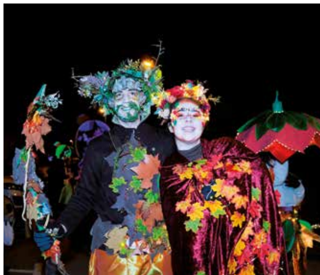
Fotografía: Los elementos de la naturaleza tuvieron mucha presencia en la cabalgata de este año.

La fantasía continuó con un grupo de grandes regalos, que despertó nuestra imaginación y abrió paso al espectacular Reino del Mar, poblado por tritones, medusas luminosas y corales que acompañaron la carroza del Rey Melchor, símbolo de la sabiduría y los misterios del océano.