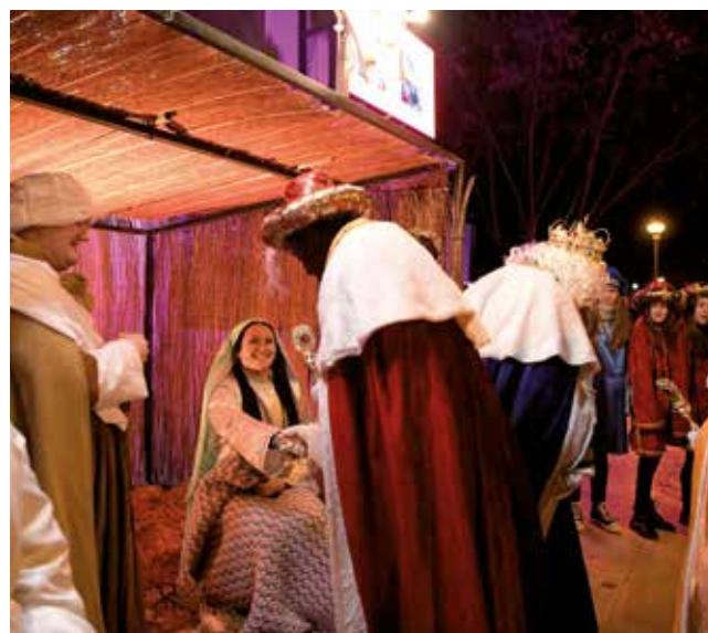
Fotografía: Sus Majestades de Oriente llevaron sus regalos al Portal de Belén.