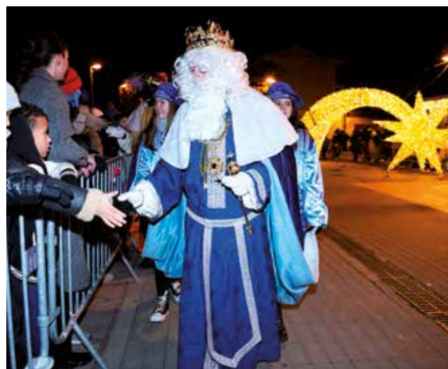
Fotografía: El 5 de enero todos volvimos a ser niños, al menos por unas horas.