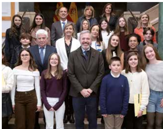
Fotografía: El presidente Jorge Azcón posa el nuevo Consejo Autonómico de Infancia y Adolescencia y otros miembros del Ejecutivo.

Sí, Izarbe Uriel ha sido elegida suplente porque también merecía estar aquí. Era también una candidata excepcional que siempre aporta ideas y está también muy implicada.