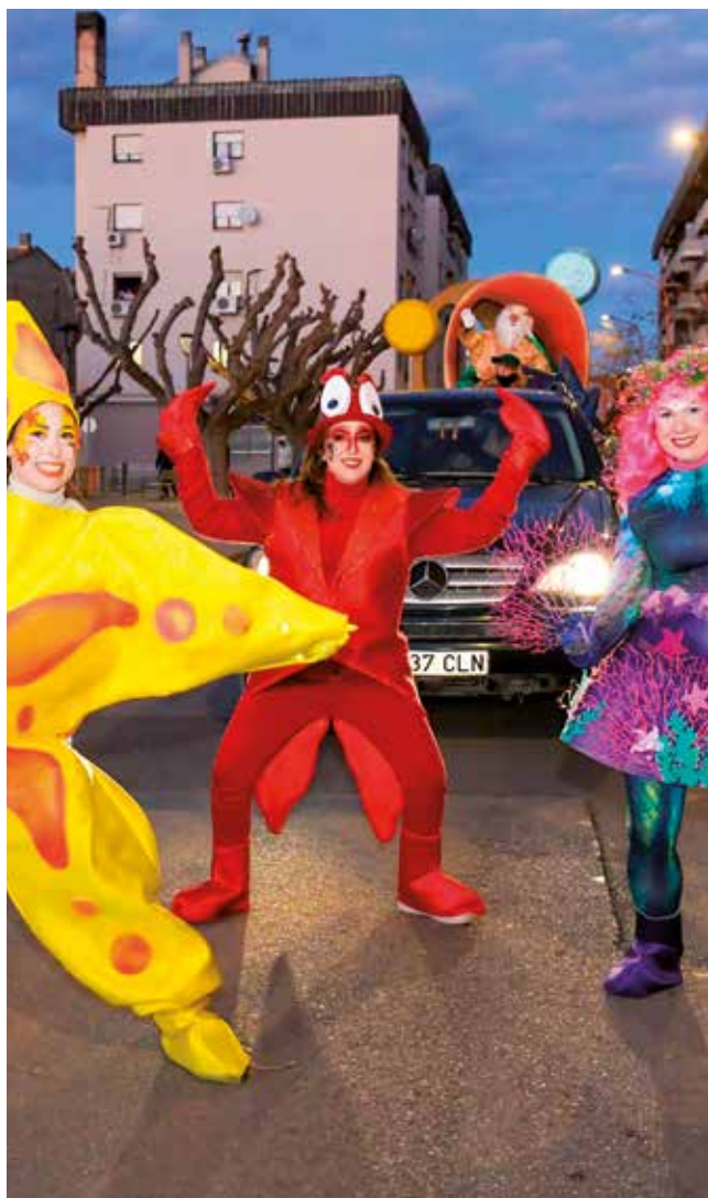
Fotografía: Estrellas de mar, tritones, medusas luminosas y corales acompañaron al Rey Melchor.

Tras ella, un grupo de instrumentos de viento llenó las calles de melodías festivas, preparando al público para la llegada de la Cartera Real, acompañada por un séquito de sobres danzantes encargados de recoger las cartas y custodiar los deseos de los más pequeños hasta hacerlos llegar Sus Majestades.