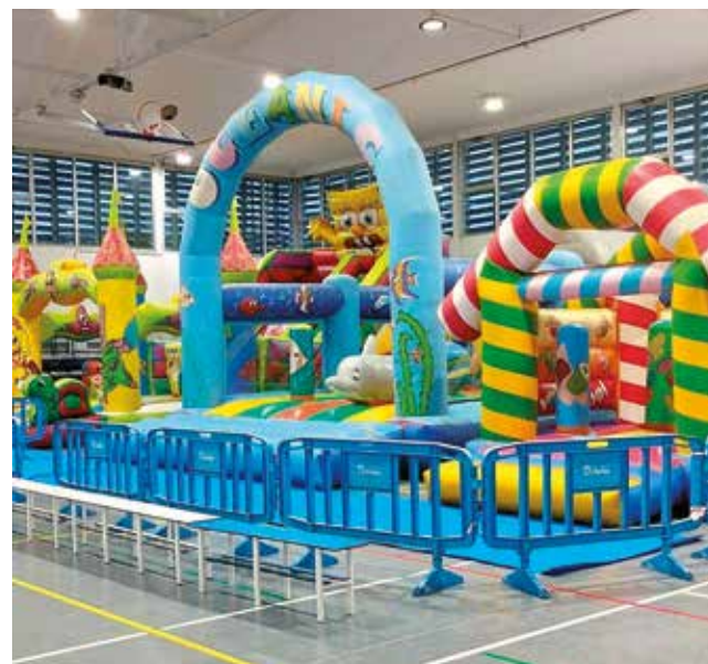
Fotografía: Los hinchables de Navidadia siempre triunfan en el ocio navideño.

Con estas iniciativas, Utebo reafirma su compromiso con una Navidad inclusiva y participativa para todas las edades.