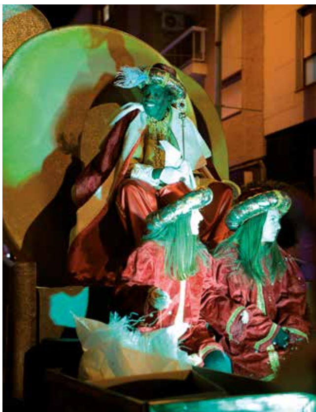
Fotografía: El Rey Baltasar fue precedido de la Tribu de los Pueblos del Mundo llenos de ritmo y energía.

La organización agradeció especialmente la colaboración de Policía Local, Protección Civil, la Asociación de Amas de Casa y Simpatizantes de San Juan y la Asociación de Mujeres Los Espejos, cuyo apoyo resultó fundamental para que Utebo viviera una cabalgata llena de magia, luz y alegría compartida.