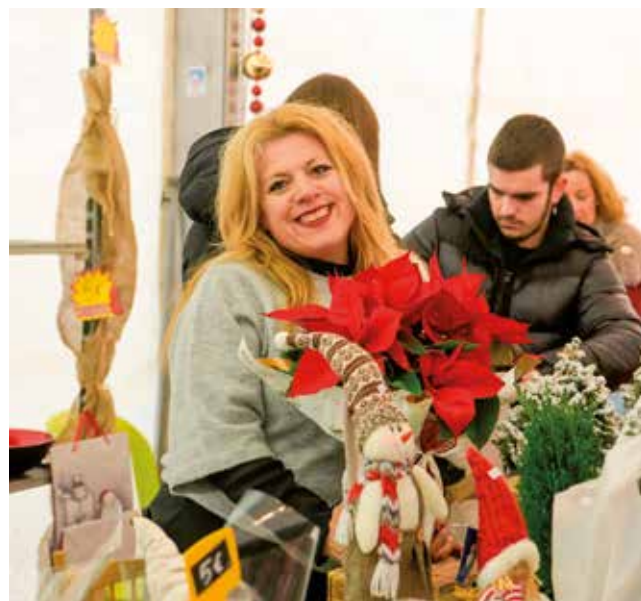
Fotografía: La feria fue una auténtica fiesta del comercio de proximidad.