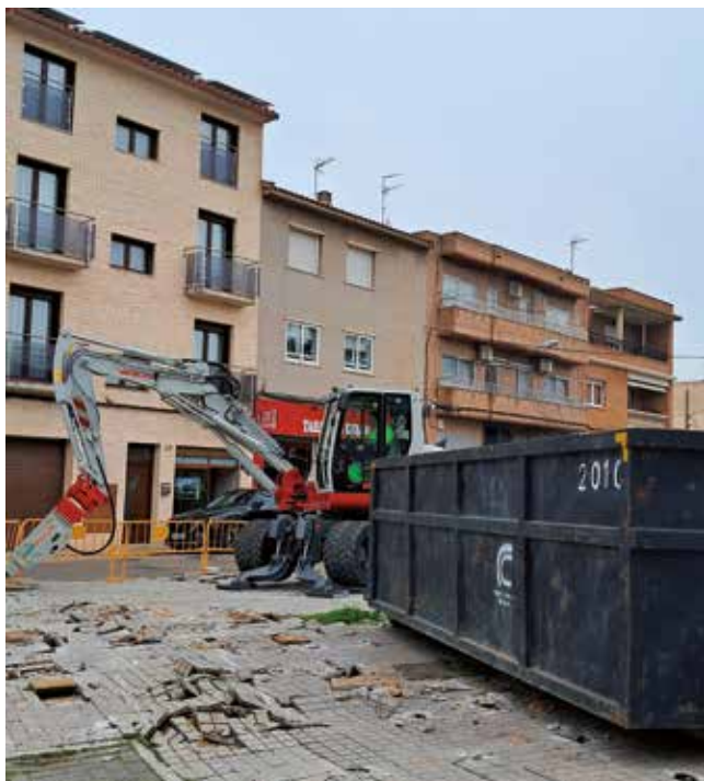
Fotografía: La Plaza Plaisance du Touch se prepara para una remodelación completa.

El Ayuntamiento de Utebo continúa trabajando para mejorar la movilidad y el uso del espacio público con actuaciones que buscan hacer la ciudad más cómoda, accesible y funcional para vecinos y visitantes. Dentro de esta línea de trabajo se enmarca la puesta en marcha de varios proyectos orientados a optimizar el estacionamiento y facilitar la circulación en zonas con alta demanda de plazas.