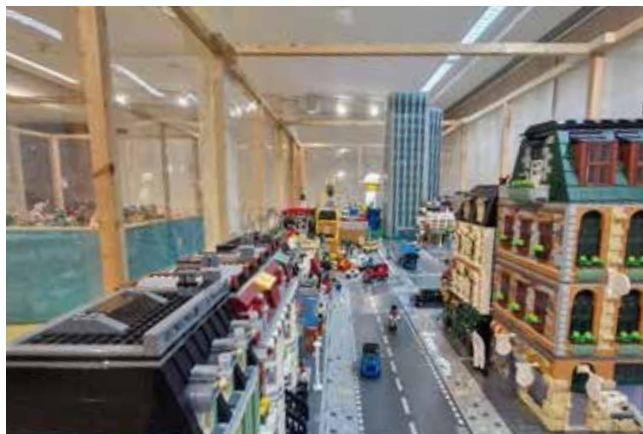
Fotografía: La exposición ha conquistado a niños y adultos por igual.

La exposición de LEGO que ha estado instalada en el Centro Cultural Mariano Mesonada durante la época navideña ha superado todas las expectativas y se ha consolidado como uno de los grandes atractivos culturales y familiares de estas fiestas. Desde su inauguración el pasado 14 de diciembre de 2025 hasta cuatro días antes de su clausura el 16 de enero, la muestra había registrado más de 4.000 visitantes, cifra que refuerza el enorme interés que ha despertado entre vecinos y visitantes.