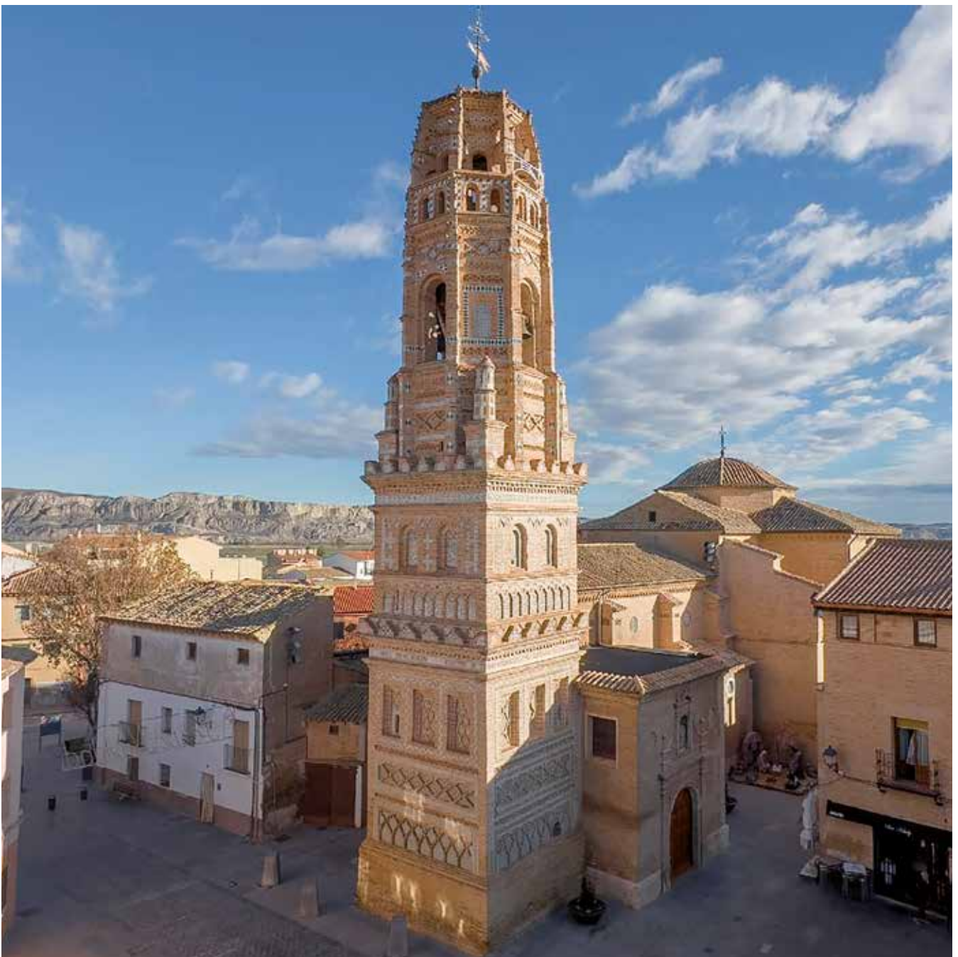
Fotografía: Utebo afronta 2026 con el presupuesto más ambicioso de su historia.

Con este presupuesto histórico, Utebo se dota de herramientas para afrontar nuevos retos sin perder de vista la sostenibilidad económica. Más servicios, más inversión y una gestión orientada a lo cotidiano definen unas cuentas que marcan un antes y un después en la planificación municipal y que sitúan a Utebo en una posición de fortaleza para seguir creciendo en los próximos años.