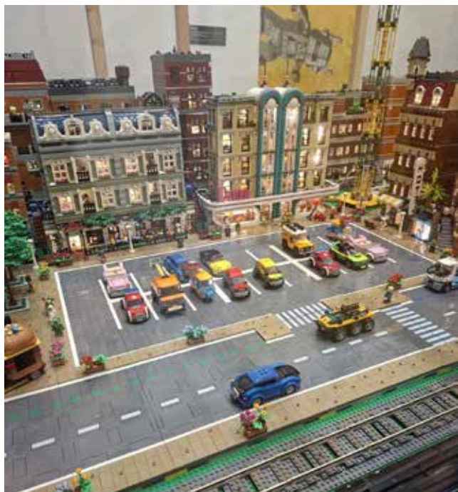
Fotografía: Durante la muestra, se podía jugar a localizar personajes escondidos entre los montajes.

La exposición de LEGO que ha estado instalada en el Centro Cultural Mariano Mesonada durante la época navideña ha superado todas las expectativas y se ha consolidado como uno de los grandes atractivos culturales y familiares de estas fiestas. Desde su inauguración el pasado 14 de diciembre de 2025 hasta cuatro días antes de su clausura el 16 de enero, la muestra había registrado más de 4.000 visitantes, cifra que refuerza el enorme interés que ha despertado entre vecinos y visitantes.