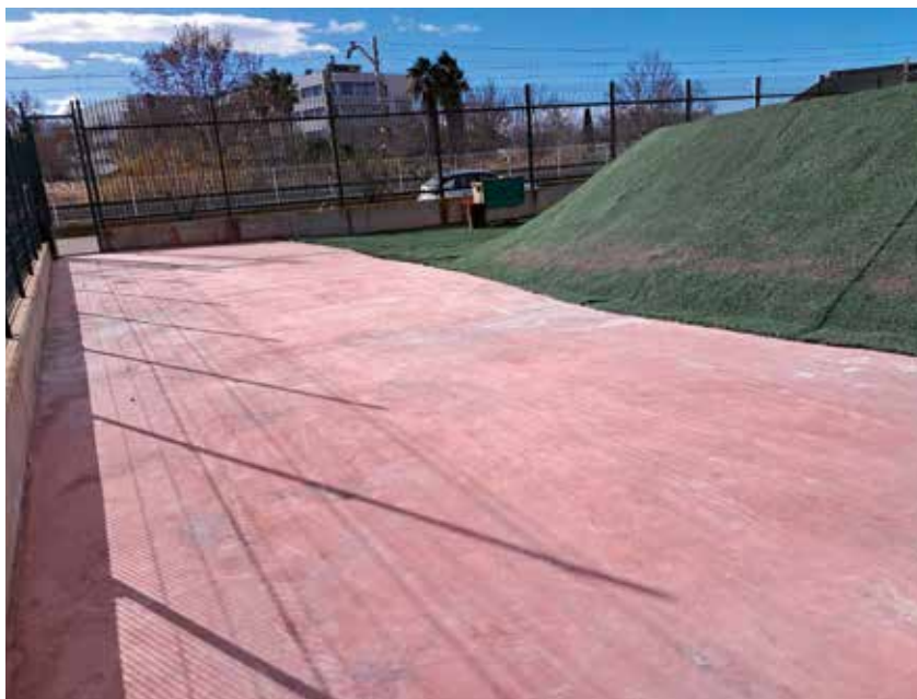
Fotografía: Circuito de BMX remodelado.

El Ayuntamiento de Utebo continúa apostando por la mejora de las instalaciones deportivas con una nueva actuación en el circuito BMX, que ha sido recientemente remodelado para ofrecer un espacio más seguro, moderno y atractivo tanto para deportistas como para aficionados.