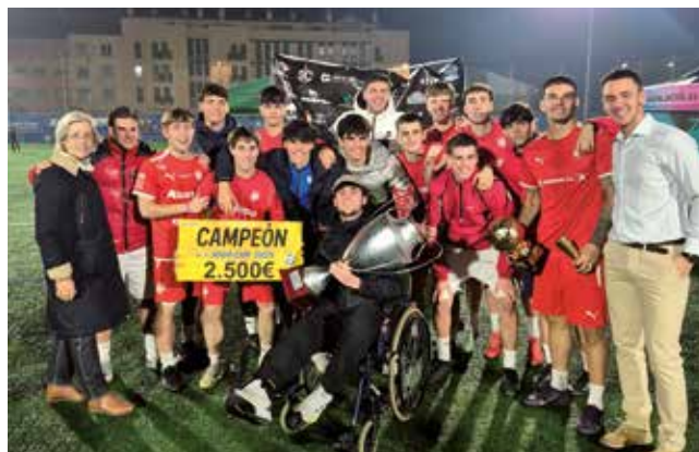
Fotografía: Ganadores de la primera Jogo Cup de Utebo en diciembre.