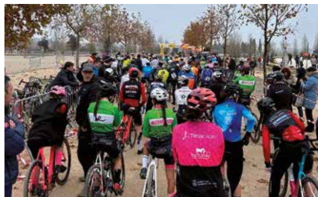
Fotografía: El Ciclocrós de Utebo es una de las pruebas más esperadas del calendario ciclista.

Con un ambiente cercano y una excelente organización, el Ciclocrós de Utebo volvió a demostrar por qué es una de las citas invernales más esperadas del calendario ciclista en Aragón.