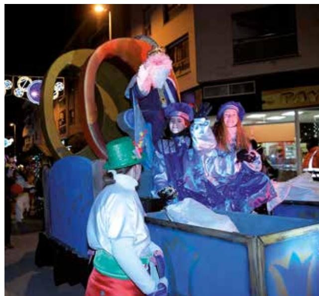
Fotografía: Este año participaron 97 personas y tanto asistentes como organizadores reconocieron la labor de los voluntarios.