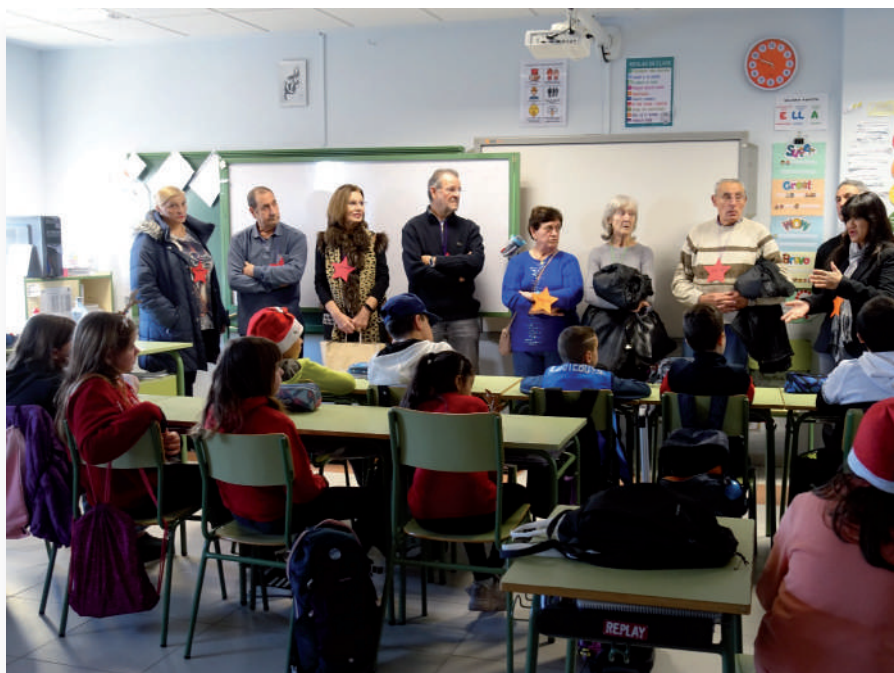
Abuelas y abuelos acudieron al colegio Parque Europa.

Si estás interesado/a en participar, puedes inscribirte hasta el 28 de febrero, en el edificio polifuncional del Ayuntamiento, ubicado en la avenida de Navarra, 12.