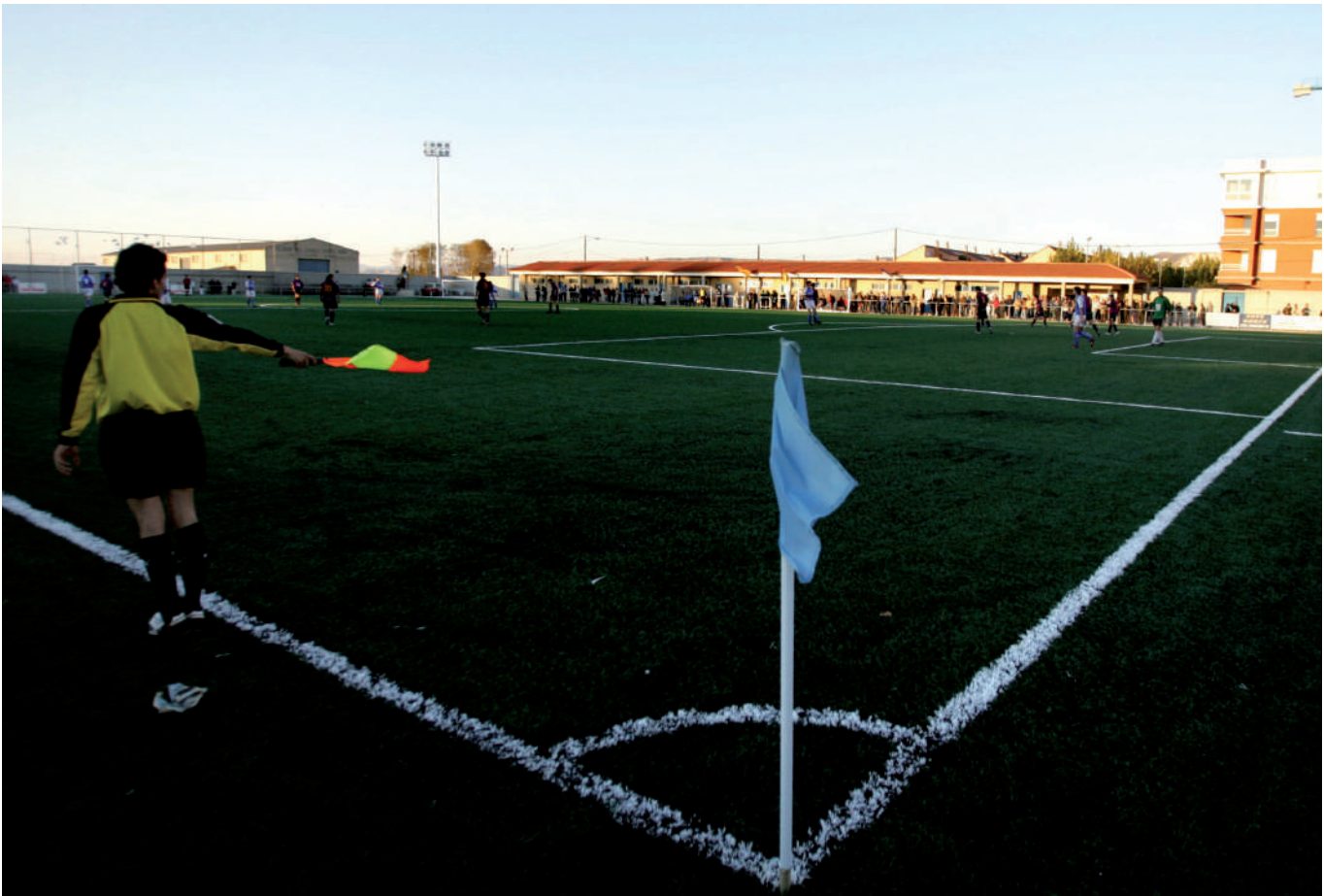
Campo de fútbol municipal Santa Ana.