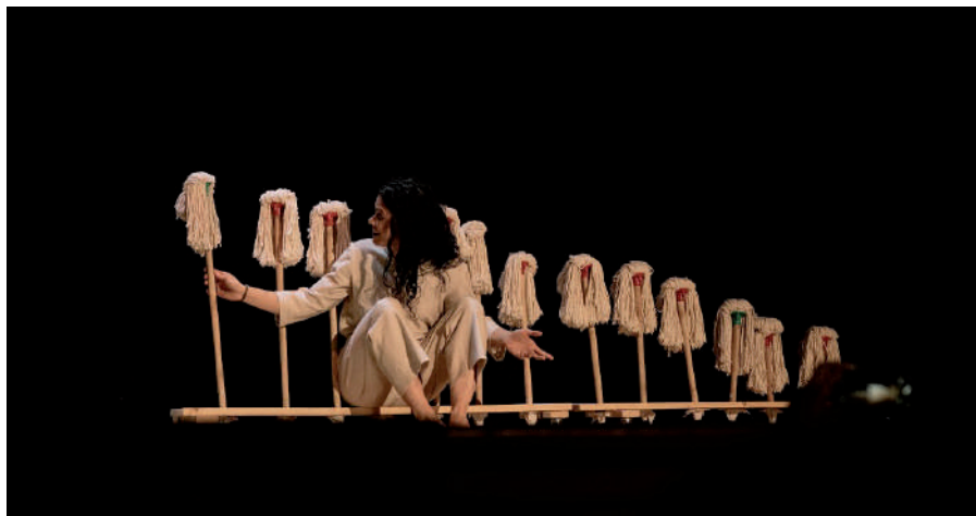
Arriba, función de 'El viejo y el mar', de Teatro Che y Moche. Sobre estas líneas, 'Los pasos de Inés'

siona con la conmovedora aventura de la vida a través de las imágenes más bellas; video mapping, música y actores cautivan y emocionan desde el primer segundo con su sorprendente puesta en escena trasladando al espectador a un mundo de nuevas experiencias fascinantes.