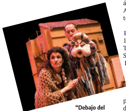
“Debajo del tejado”, de Pata Teatro.

La emoción al contemplar obras artísticas es equiparable a la de sentir la música. Si esa música pone soni-