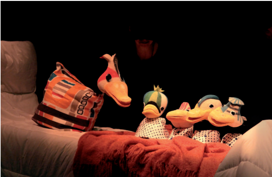
“Pato feo”, de Teatro Arbolé.