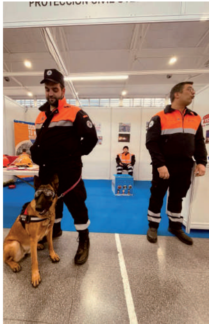
El grupo de Protección Civil de Utebo participó con su perro en la II Feria de Comercio de Proximidad. También lo hizo la academia Marta's Corner, con experimentos y juegos en inglés para los más pequeños.

Los años de sequía por la pandemia y la consiguiente no celebración de la Feria del Comercio de Proximidad de Utebo añadía ganas a este evento que reunía, en esta ocasión a una treintena de expositores locales. Durante el fin de semana en el que se desarrolló, unas 5.000 personas se acercaron al pabellón Las Fuentes para disfrutar no solo de los diferentes stands con sus productos y servicios sino también de las distintas actividades organizadas para los diferentes públicos, desde los más pequeños hasta los más mayores, desde la ludoteca hasta la degustación de jamón entre otras cosas. Un total de 31 stands representantes