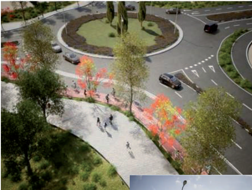
Recreaciones que aparecen en el plan propuesto por el Ministerio de Transportes para la reforma de la N-232 a su paso por Utebo.