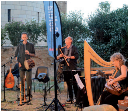
“Sonando la imagen”, de La Chaminera.