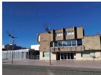
Fachada del Ayuntamiento.

El Ayuntamiento aprobó el pasado mes de noviembre la bajada del tipo de gravamen de este impuesto pasando del 0,485% al 0,455% del valor