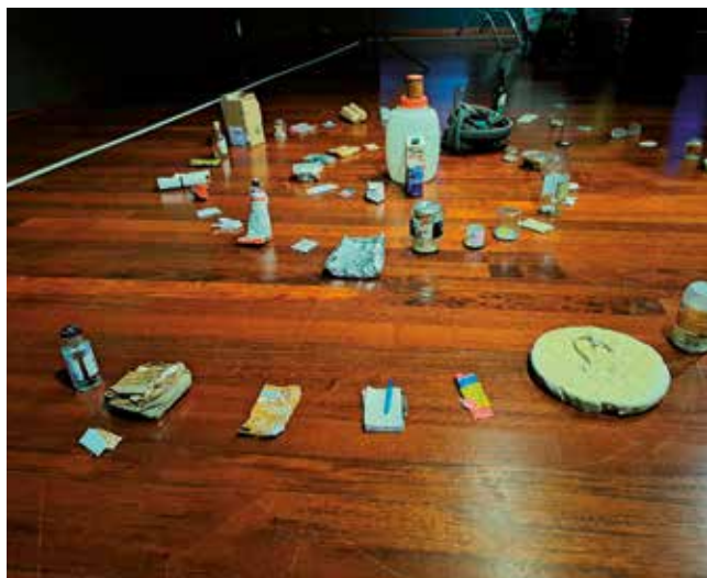
Fotografía: A través del juego se insistió en la separación correcta de los residuos.

Del 24 al 29 de noviembre, Utebo se sumó a la Semana Europea de Prevención de Residuos (SEPR25) con una propuesta pionera que implicó de forma activa a la comunidad educativa del municipio. Más de 150 alumnos y alumnas de 5º y 6º de Primaria de los colegios Octavus, Infanta Elena y Parque Europa participaron en una actividad lúdica y formativa centrada en el reciclaje y la correcta separación de residuos.