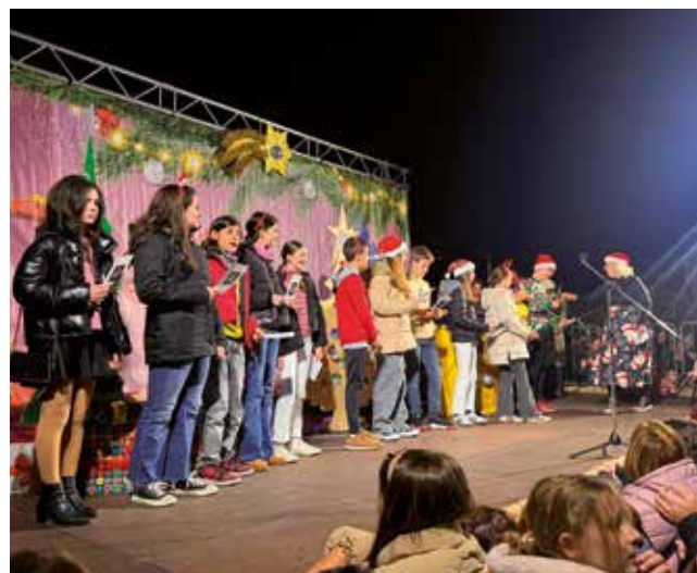
Fotografía: Hay más de 300 actividades para todos los públicos programadas esta Navidad.