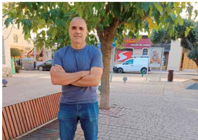
Fotografía: Alfredo Roqueta en Utebo.

No solo el traje de luces que hicimos para Madonna, también todo lo que hemos trabajado para la Ópera de París, Londres, Estrasburgo, Venecia, incluso fuera de Europa, para ciudades como San Francisco, Chicago, Sídney... Nos ha faltado la Scala de Milán y el Metropolitan de Nueva York. Hasta todos esos lugares hemos llevado con orgullo el nombre de Utebo.