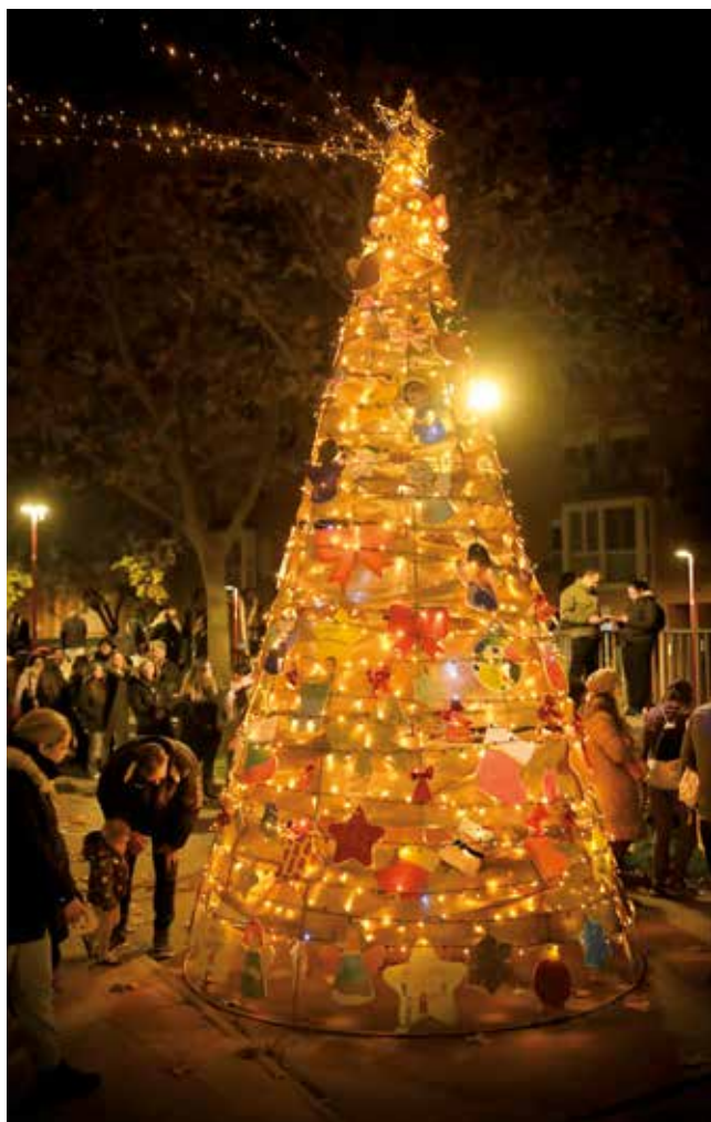
Fotografía: Además del acto de encendido, los vecinos disfrutaron de una deliciosa chocolatada.

El encendido lo protagonizó el Foro Joven Utebo, junto con escolares del Colegio Infanta Elena, quienes se encargaron de iluminar el barrio. Tras la cuenta atrás, las luces se encendieron y la plaza se vistió de magia navideña. “Este acto es más que encender unas bombillas, es un símbolo de lo que significa la navidad para el barrio de Malpica”, afirmó una de las representantes del Foro Joven.