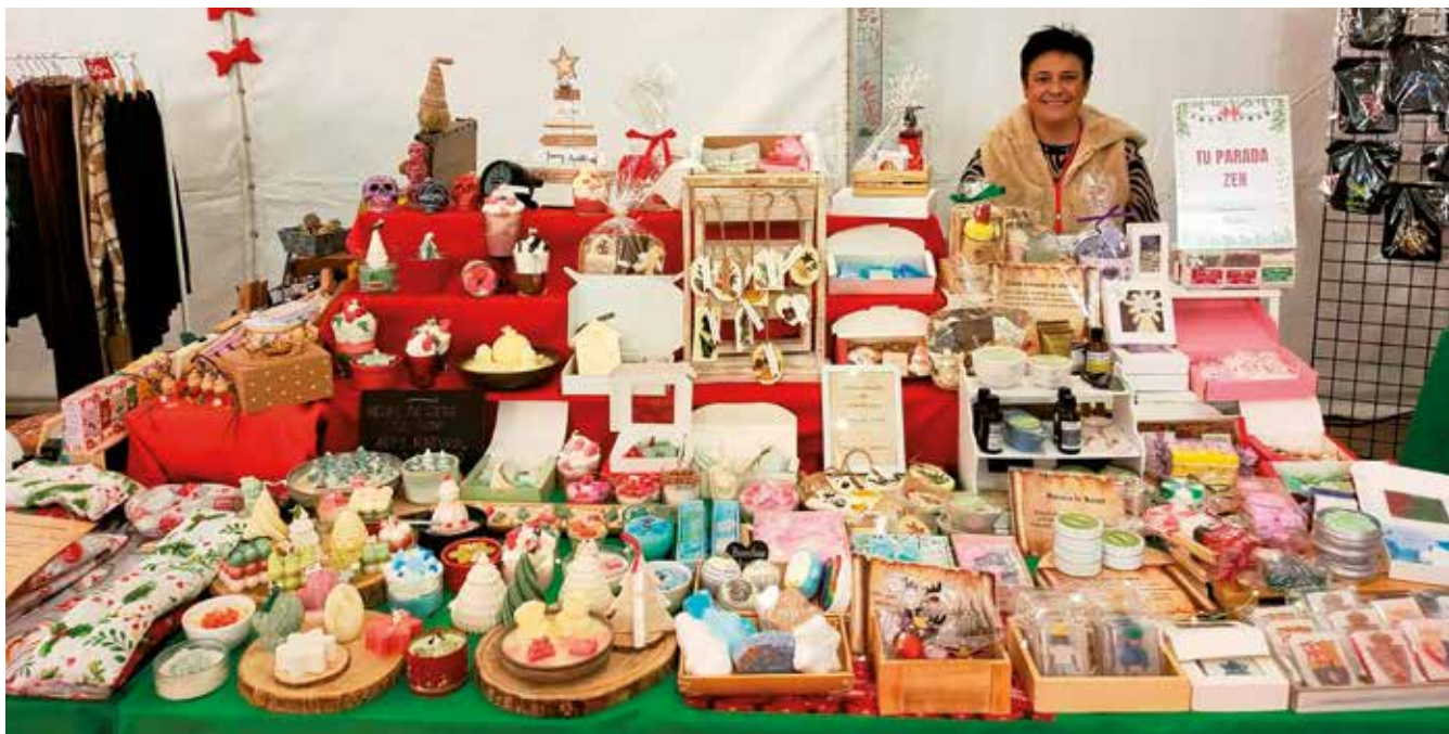
Fotografía: Feria del Comercio

U tebo volverá a convertirse en un gran escaparate local durante los días 12, 13 y 14 de diciembre con la celebración de la III Feria Navideña del Comercio, un evento ya consolidado que reunirá a vecinos y visitantes en torno al comercio de proximidad.