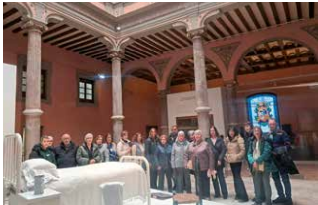
Fotografía: Visita a la exposición por el 600 aniversario del hospital de Nuestra Señora de Gracia.

Las visitas culturales gratuitas impulsadas por el Área de Cultura del Ayuntamiento es una de las actividades más demandadas por los vecinos y antes de que acabe el año tenemos una nueva oportunidad de participar en una de ellas.