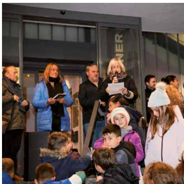
Fotografía: La Navidad arrancó en Malpica, desde donde también partirá la cabalgata de Reyes.

Pero esto fue solo el principio. Con ese encendido arrancó una programación festiva que acompañará al barrio hasta el 5 de enero. Se anunció que la tradicional Cabalgata de Reyes comenzará estas fiestas en Malpica antes de continuar su recorrido por el resto de Utebo. Así, este barrio, como todo el municipio, se prepara para vivir una Navidad llena de actividades, convivencia y momentos especiales para cada familia.