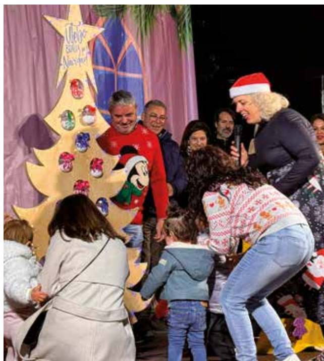
Fotografía: Los más pequeños de Utebo también pudieron participar.

También se inauguró el Bosque Navideño de la Participación, uno de los proyectos más queridos por los vecinos. Cada año esta instalación crece gracias al trabajo conjunto de asociaciones, centros educativos y vecinos que colaboran para convertirlo en una auténtica obra colectiva. Allí también se presentó el Árbol de los Deseos de la Biblioteca Municipal, donde numerosos niños ya comenzaron a colgar sus mensajes para el nuevo año.