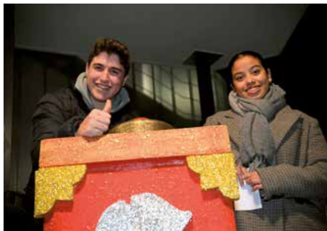
Fotografía: Integrantes del Foro Joven Utebo dieron la bienvenida a la Navidad en Malpica.

La celebración finalizó de la forma más dulce posible, con una chocolatada popular - churros incluidos- que hizo las delicias de los vecinos.