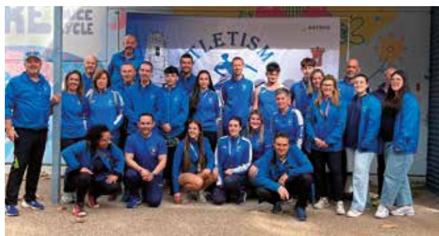
Fotografía: El Club de Atletismo Utebo impulsó una jornada de deporte y solidaridad.

La jornada combinó deporte y solidaridad, ya que los participantes y asistentes pudieron colaborar con la recogida de alimentos, destinada a ayudar a las familias más necesitadas del municipio.