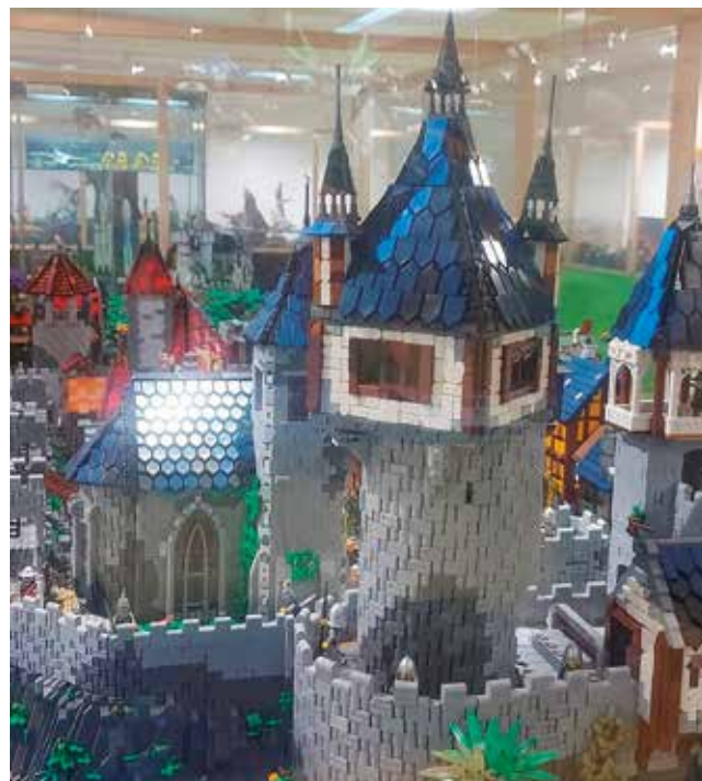
Fotografía: ¿Encontrarás todos los gazapos en las escenas de Lego_

No faltará su popular concurso de gazapos, en el que los asistentes deberán localizar “minifigs” ocultos entre las construcciones. La exposición podrá visitarse todos los días de 10:00 a 14:00, y por las tardes de martes a sábado, de 16:00 a 21:00.