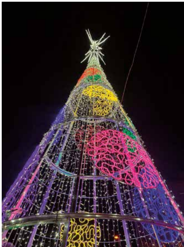
Fotografía: El árbol de Navidad de la Plaza Constitución mide 11 metros este año.

Utebo volvió a vivir una de sus tardes más especiales el pasado 28 de noviembre, cuando cientos de vecinos se reunieron en la Plaza Constitución para asistir al esperado encendido de las luces navideñas. Familias enteras, niños llenos de nervios y grupos de amigos fueron llegando poco a poco, creando ese ambiente único que solo se respira cuando la Navidad está a punto de comenzar.