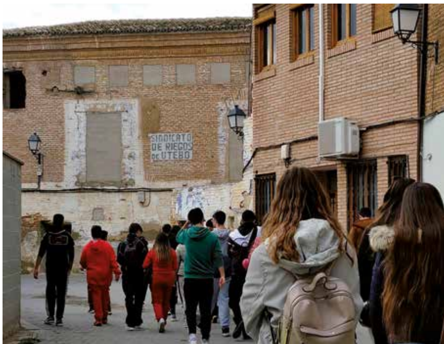
Fotografía: 80 niños de Utebo de entre 5 y 9 años han participado en la experiencia.

E l Ayuntamiento de Utebo, miembro de la Asociación Territorio Mudéjar desde 2022, ha desarrollado un completo programa de didáctica del patrimonio dirigido a escolares del municipio. Durante estas actividades, se han realizado cinco talleres en colaboración con los colegios CP Infanta Elena, CEIP Miguel de Artazos y el colegio de educación especial La Purísima, dirigido a niños sordos.