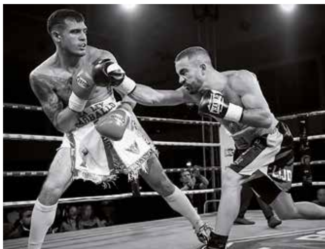
Fotografía: El boxeo es un deporte en auge. @boxeok1utebo.