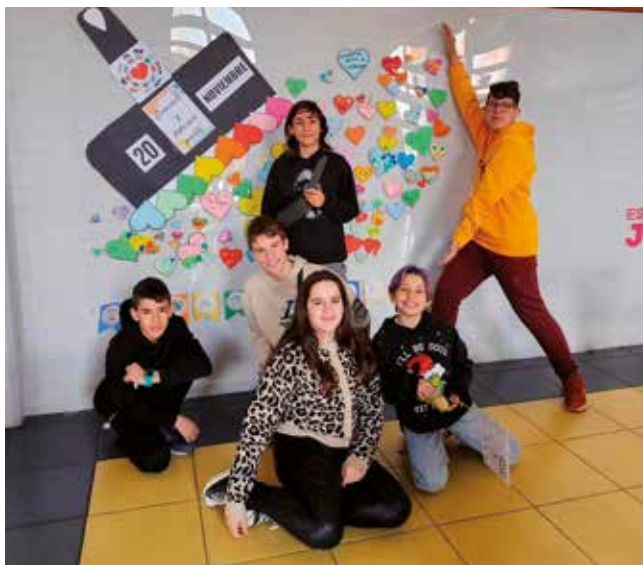
Fotografía: Día de la Infancia en el Espacio Joven.

El pasado 23 de noviembre, el Consejo de Infancia y Adolescencia de Utebo organizó una mañana muy especial para toda la familia en el Espacio Joven, con motivo del Día de los Derechos del Niño. La jornada combinó creatividad, diversión y participación, ofreciendo a los