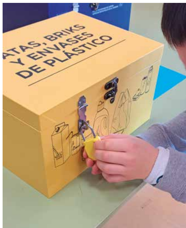
Fotografía: Más de 150 alumnos participaron en esta actividad lúdica y formativa.

Con iniciativas como estas, Utebo reafirma su compromiso con la educación ambiental y los valores sostenibles, formando a las nuevas generaciones y promoviendo una comunidad más consciente y comprometida con el cuidado del planeta.