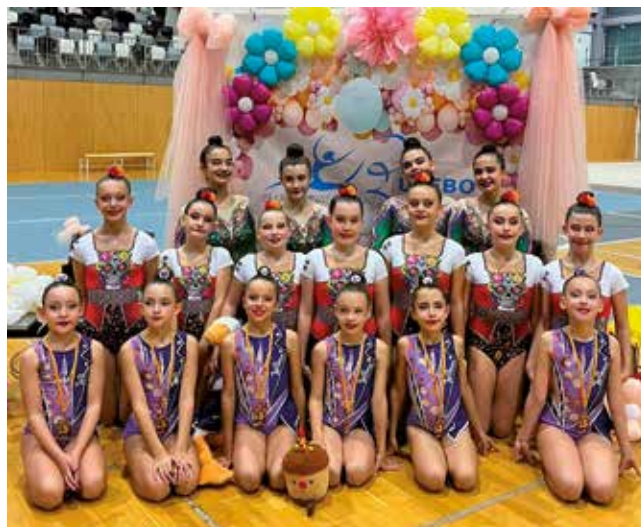
Fotografía: Participantes del Club Gimnasia Rítmica Utebo.