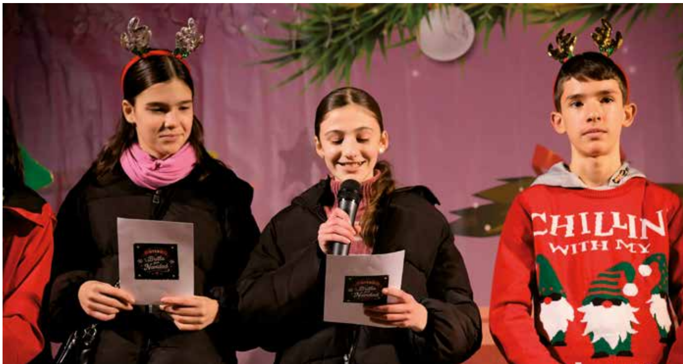
Fotografía: Los jóvenes uteberos dieron el pistoletazo de salida a la programación navideña.