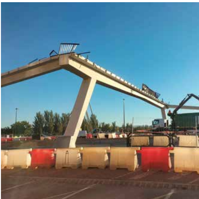
Fotografía: Las obras para transformar la antigua N-232 avanzan según lo previsto. Julio Lancis.

Además, los trabajos van dejando asomar poco a poco cómo será el trazado definitivo una vez terminado el proyecto, como, por ejemplo, las rotondas de la avenida de Zaragoza y la de la avenida de Puerto Rico, a la altura de las calles de su mismo nombre, que ya son fijas y están ubicadas en su espacio definitivo, aunque evidentemente su fisonomía será diferente.