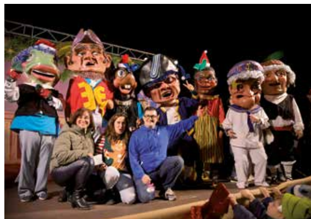
Fotografía: El Consejo de Infancia y los Cabezudos encendieron la Navidad.