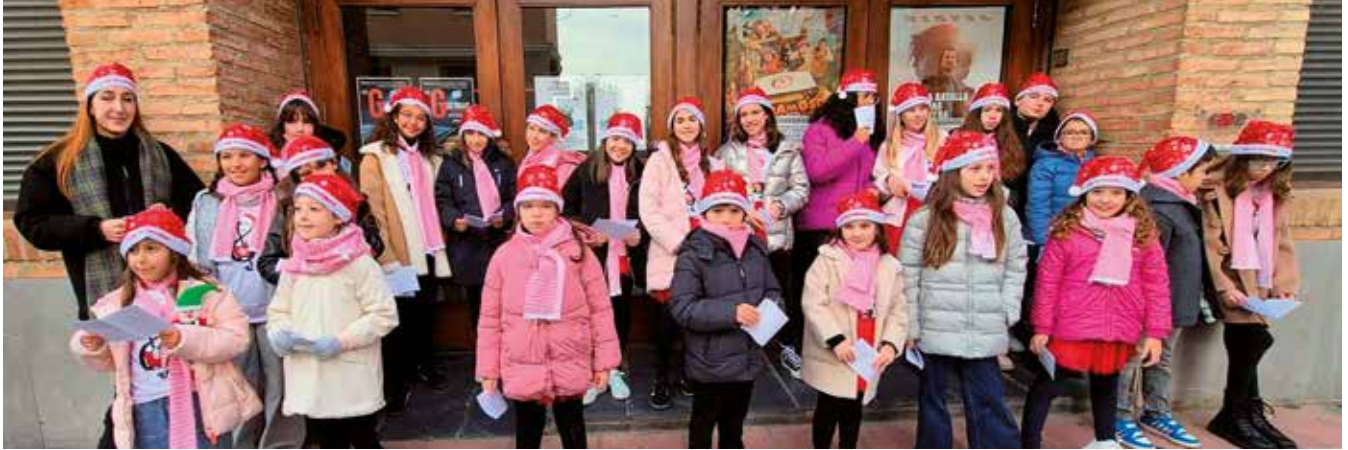
Fotografía: Los niños del CEIP Octavus pidieron el aguinaldo cantando villancicos.

La Navidad volvió a sentirse en las calles de Utebo el sábado 29 de diciembre gracias al aguinaldo navideño del alumnado del CEIP Octavus. Desde las 11 de la mañana, el coro inició su recorrido por la calle Berbegal y otras zonas, llenándolas de música y emoción. Muchos vecinos se detuvieron para escuchar sus villancicos y acompañarles, convirtiendo cada parada en un pequeño concierto que recordaba la esencia de estas fechas.