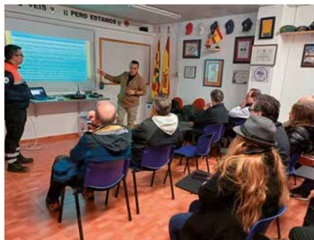
Fotografía: El Canal 8 PMR Utebo funciona si fallan los canales habituales como el teléfono o internet

Uno de los pilares del proyecto es la participación vecinal. Al tratarse de una red comunitaria, su eficacia depende de que los ciudadanos dispongan de estas radios, las utilicen y permanezcan en escucha activa. Para facilitar su implantación, Protección Civil Utebo anunciará a través de sus redes sociales (Facebook e Instagram) el