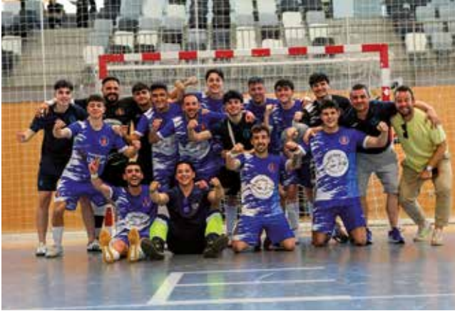
Fotografía: El Utebo Fútbol Sala pasa a la Final Four de la Copa Aragón.

El Utebo Fútbol Sala firmó una gran actuación el pasado 23 de abril al imponerse por 4-1 al Tauste F.S., logrando así un merecido pase a la Final Four de la Copa Aragón. El equipo local mostró intensidad, compromiso y un juego sólido que le permitió dominar el encuentro y asegurar su presencia en la fase final de la competición.