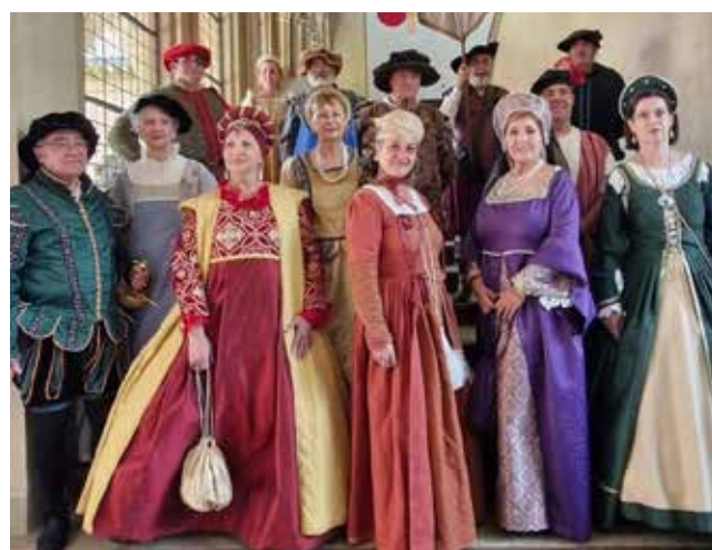
Fotografía: La Feria Mudéjar de Utebo está declarada Fiesta de Interés Turístico en Aragón desde 2016.