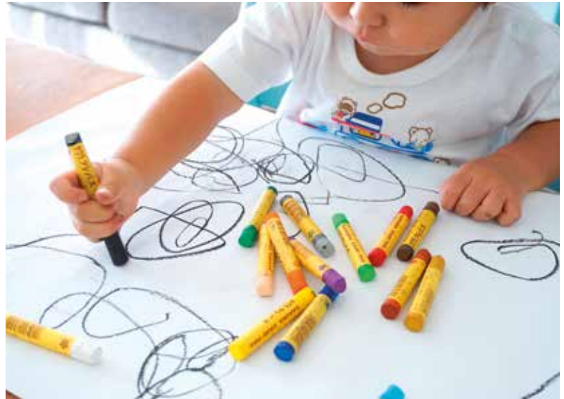
Fotografía: El concurso está dirigido a alumnado empadronado en Utebo de Infantil, Primaria y Secundaria.

Las Fiestas de San Lamberto ya están en el horizonte y el Ayuntamiento de Utebo lanza el II Concurso Infantil de Cartel de Fiestas, una propuesta que invita a los más jóvenes a crear la imagen oficial de las celebraciones patronales que tendrán lugar del 18 al 21 de junio. El certamen cuenta con la colaboración de la Asociación Provincial de Industriales Feriantes de Zaragoza.