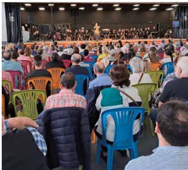
Fotografía: La actuación de la Agrupación Musical Santa Ana y Escuela de jota