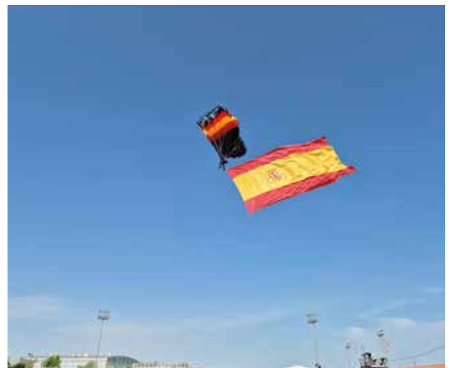
Fotografía: Uno de los paracaidistas desplegó una bandera de España durante el descenso.

escena cargada de significado y sentimiento de unidad. Un espectáculo que, sin duda, quedará grabado en la memoria de todos los asistentes.