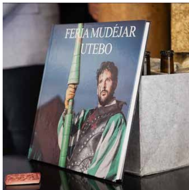
Fotografía: El Ayuntamiento ha editado el libro Mudéjar, que recoge los 15 años de historia de la feria.

La Feria Mudéjar volverá a llenar las calles del municipio de historia, tradición y participación, reafirmando su papel como motor cultural, social y turístico. Un evento que, edición tras edición, sigue creciendo y proyectando la identidad de Utebo más allá de sus fronteras.