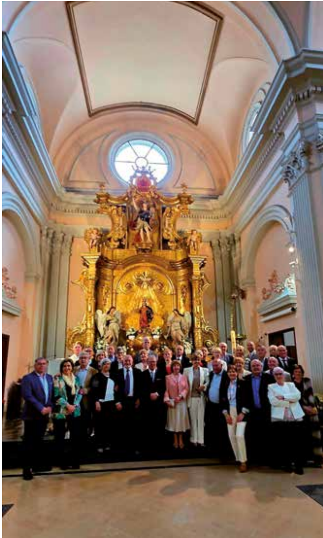
Fotografía: Los homenajeados renovaron simbólicamente sus votos en la Iglesia.

El pasado 18 de abril, Utebo vivió una jornada muy especial con la celebración del homenaje a las Bodas de Oro, un acto cargado de emoción en el que dieciocho parejas del municipio celebraron sus 50 años de convivencia rodeadas del cariño de familiares, vecinos y representantes municipales.