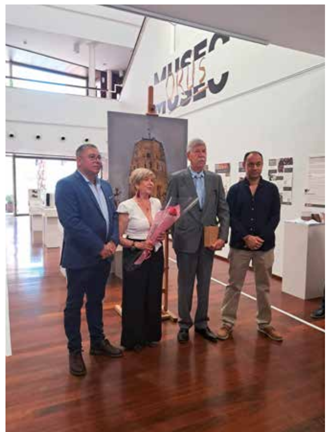
Fotografía: Cada matrimonio recibió un obsequio conmemorativo como recuerdo.

Un homenaje sincero a historias que también forman parte de la historia de Utebo.