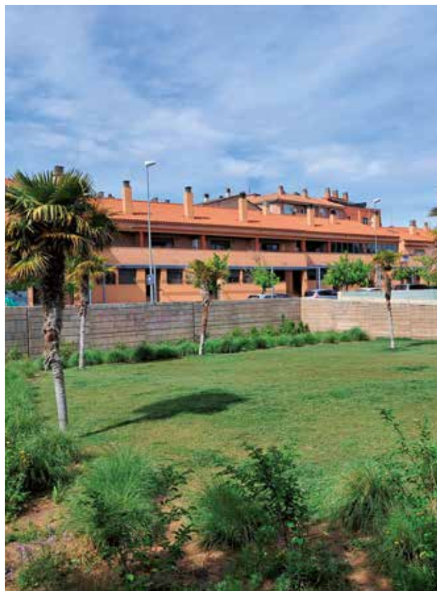
Fotografía: El nuevo espacio está pensado para perros de menos de 12 kilos.

Además, se insiste en respetar las normas básicas de uso: recoger los excrementos, mantener a los perros controlados y llevar al día la identificación y cartilla sanitaria.