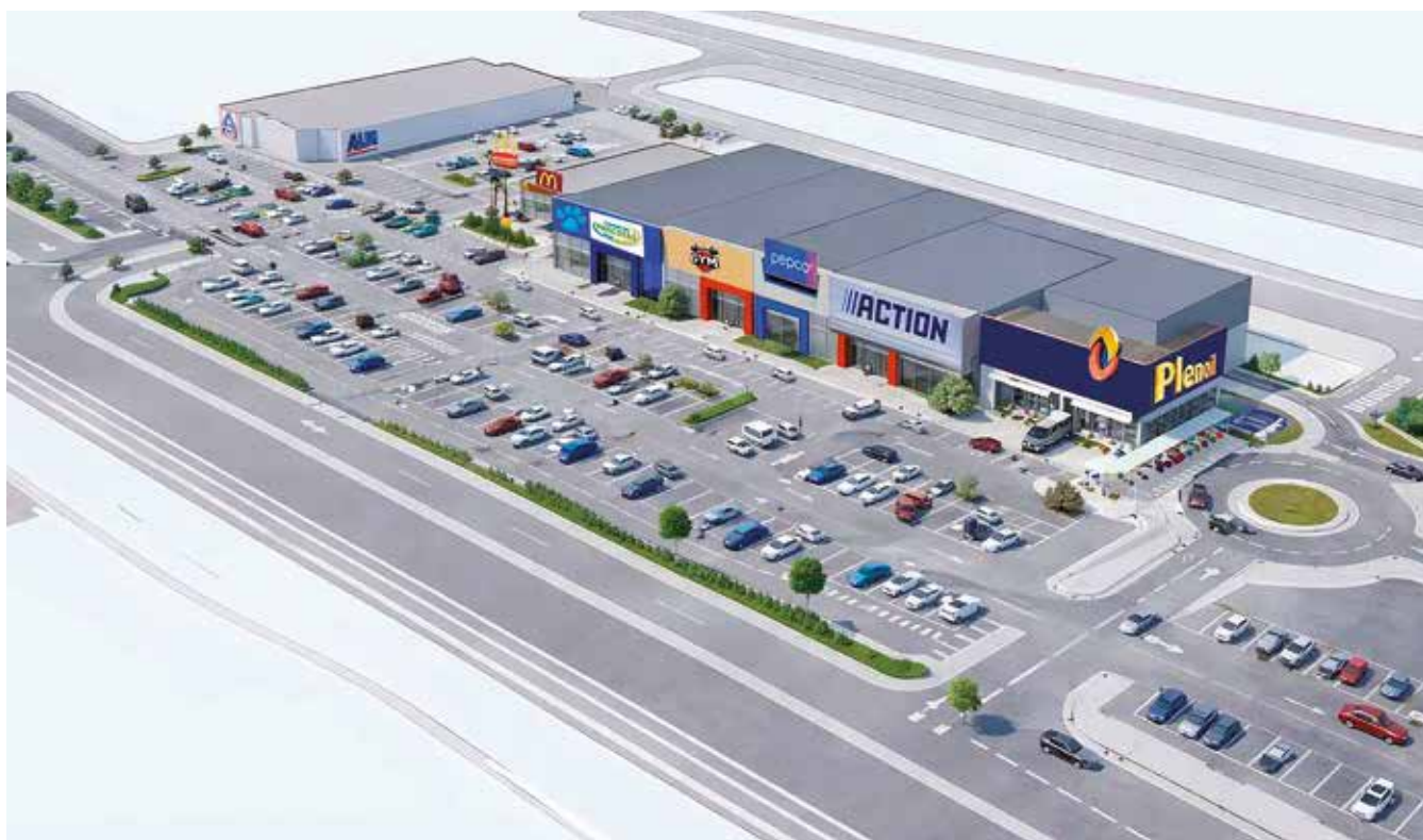
Fotografía: Aldi, McDonald's, Plenergy y Action serán las primeras marcas en instalarse

Con esta transformación, Utebo da un paso importante hacia un modelo de ciudad más conectada, dinámica y preparada para el futuro, en la que el desarrollo urbano y económico avanza de la mano para mejorar la calidad de vida de sus vecinos.