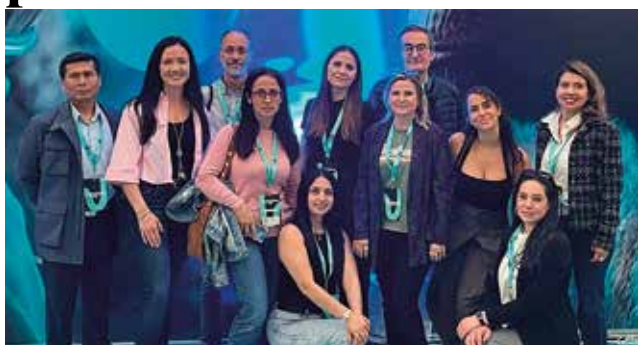
Fotografía: Los participantes del programa experiencial Utebo Tándem 2025 en The Wave.

Los participantes del programa experiencial de empleo y formación de emprendedores UTEBO EMPRENDE TANDEM 2025 asistieron a The Wave 2026, el evento impulsado por el Gobierno de Aragón en el que empresas, startups, instituciones y talento emergente comparten conocimiento, tendencias y experiencias en torno a la innovación, la tecnología y el emprendimiento.