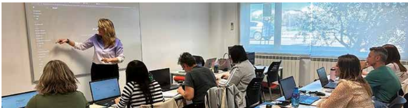
Fotografía: La oferta formativa y de talleres del Centro de Formación para el Empleo roza el 100%.

La oferta formativa y de talleres del Centro de Formación para el Empleo roza el 100% gracias a una importante actividad que se desarrolla en horario de mañana y de tarde y que abarca formación tanto para personas desempleadas como para ocupadas.