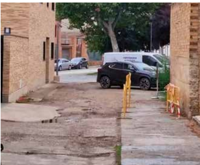
Fotografía: La calle Alberto Casañal antes y ahora.

la creación de una zona de estancia y recreo con nuevo mobiliario urbano, aparatos de gimnasia, una nueva fuente de agua potable así como ornamentos que impiden el paso de vehículos.