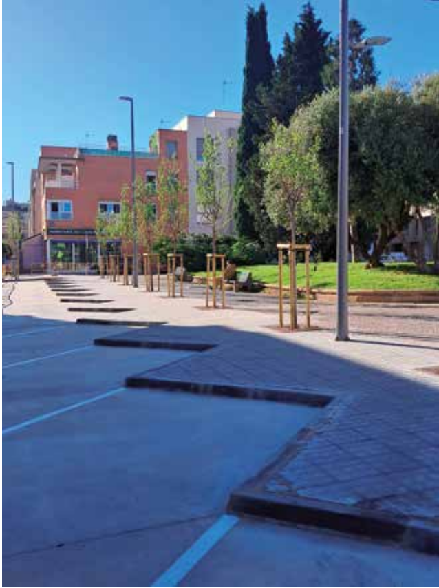
Fotografía: Plaisance Du Touch es ahora más accesible, cómoda y segura.

El Ayuntamiento de Utebo ha finalizado las obras de reforma integral de la Plaza Plaisance du Touch, una actuación muy demandada por los vecinos y vecinas de la zona que esta semana será puesta a disposición de la ciudadanía. La intervención, desarrollada en el tramo comprendido entre las calles Santiago, Pablo Gargallo, Pablo Serrano y Santa Teresa, ha supuesto una importante mejora tanto en materia de aparcamiento como de ordenación del espacio público.