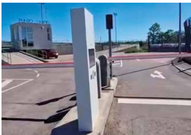
Fotografía: La barrera de acceso al punto limpio ya ha sido reparada.

La barrera del control de accesos del Punto Limpio, que se encontraba averiada, ya ha sido reparada y vuelve a estar plenamente operativa. Con esta actuación, se restablece el correcto funcionamiento del servicio, garantizando un uso adecuado de estas instalaciones municipales.