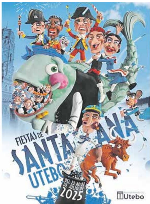
Fotografía: Cartel anunciador de las Fiestas de Santa Ana 2025.

El Ayuntamiento de Utebo ha puesto en marcha una nueva edición del Premio al cartel anunciador de las Fiestas de Santa Ana. Este certamen, que alcanza su cuarta edición, está dotado con 2.100 euros en premios,