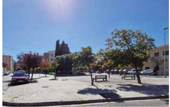
Fotografía: Plaza Plaisance du Touch sin renovar.

La actuación no se ha limitado únicamente al tráfico y al estacionamiento. Las obras han supuesto también una profunda renovación urbana que ha permitido mo-