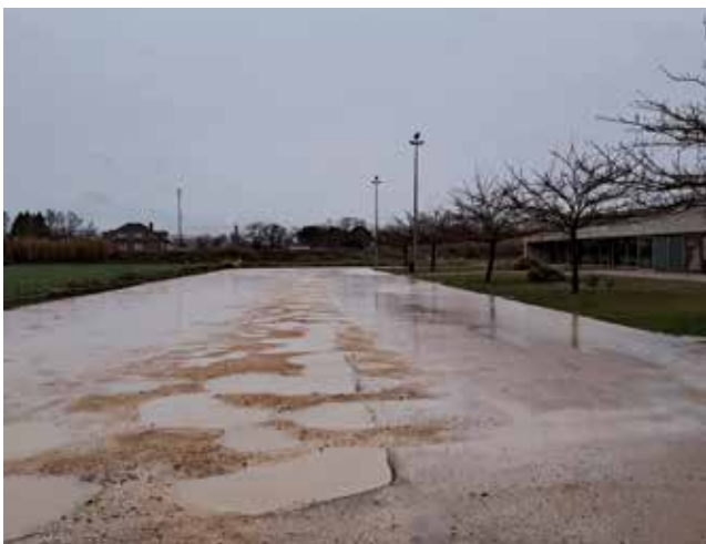
Fotografía: El aparcamiento del tanatorio antes y ahora.

teorológicas adversas. Ahora el espacio, íntegramente asfaltado, refuerza la estabilidad del terreno y garantiza una mayor durabilidad de la superficie.