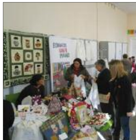
Fotografía de archivo de la pasada edición de la Feria del Voluntariado y Asociacionismo de Utebo.

Ponte en contacto con el Punto de Información al Voluntariado y Asociacionismo, los lunes y jueves de 17:00 a 20:00 h. y los miér-