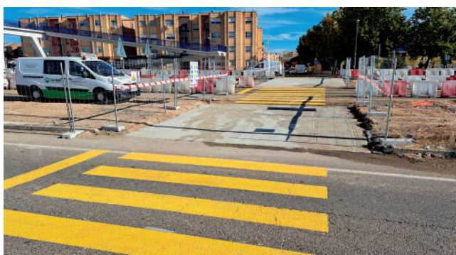
Fotografía: Se ha instalado un paso peatonal para cruzar desde la calle Tenerife hasta el centro comercial y la parada del autobús.