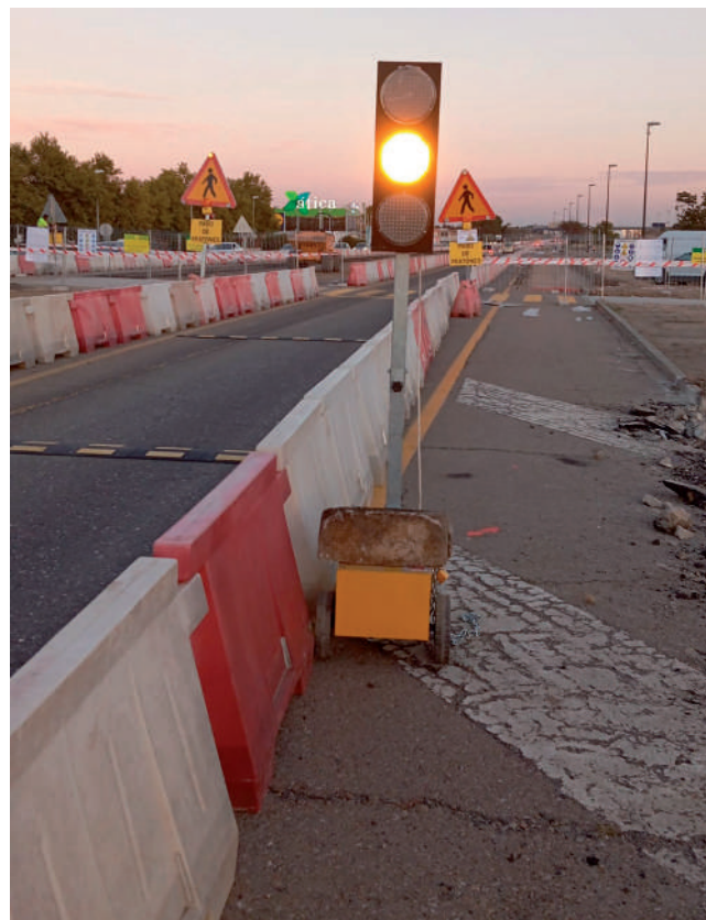
Fotografía: Los semáforos son una de las medidas para mejorar la seguridad en la vía.

nida de Navarra permanecerá cortada al tráfico, al igual que sus conexiones con la N-232, tanto de entrada como de salida del municipio. Para los desplazamientos se deberán utilizar rutas alternativas como la avenida de Zaragoza, la avenida de Puerto Rico, el Camino de la Estación y la Rotonda del Águila. Mientras duren las demoliciones, la circulación se desviará por vías provisionales y, en el resto de los trabajos, el tráfico se mantendrá mediante un único carril alternativo.