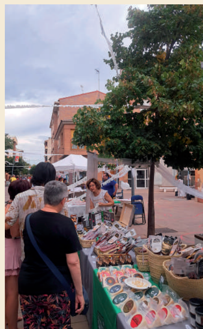
Fotografía: Una velada para promover el comercio local en la calle.