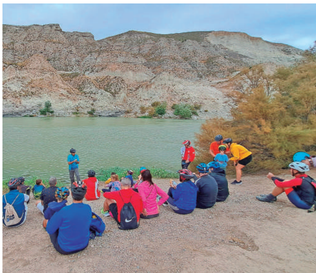
Fotografía: Nada mejor que conocer nuestro entorno en una ruta ambiental.

El miércoles se celebró la inauguración del nuevo aparcamiento de bicicletas junto a la estación de Cercanías, en colaboración con el CTAZ. Este nuevo equipamiento supone un paso más para facilitar el uso cotidiano de la bici como medio de transporte en la localidad.