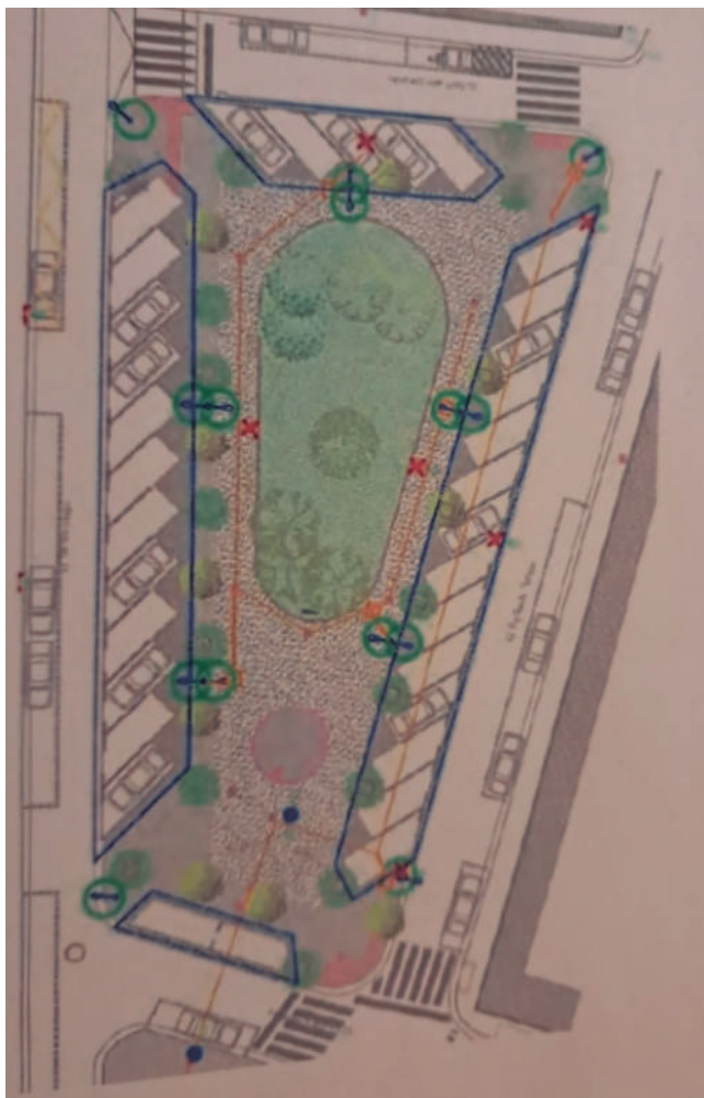
Fotografía: Proyecto de la Plaza Plaisance du Touch.

La falta de plazas disponibles y la presencia de vehículos mal estacionados han ocasionado en diversas ocasiones dificultades en la circulación, motivo por el cual el Ayuntamiento ha decidido poner en valor esta parcela municipal para el uso de los vecinos.