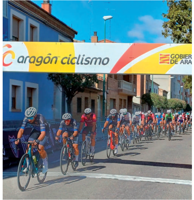
Fotografía: Emoción en la final de la Copa Aragón Criterium 2025