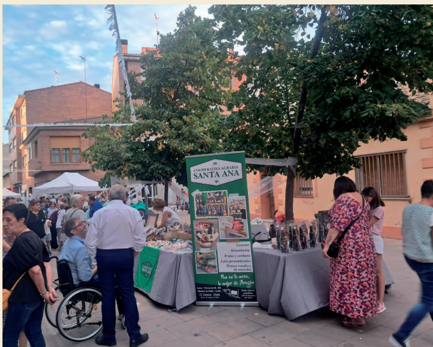
Fotografía: La Noche en Blanco promueve el comercio local en un ambiente festivo.