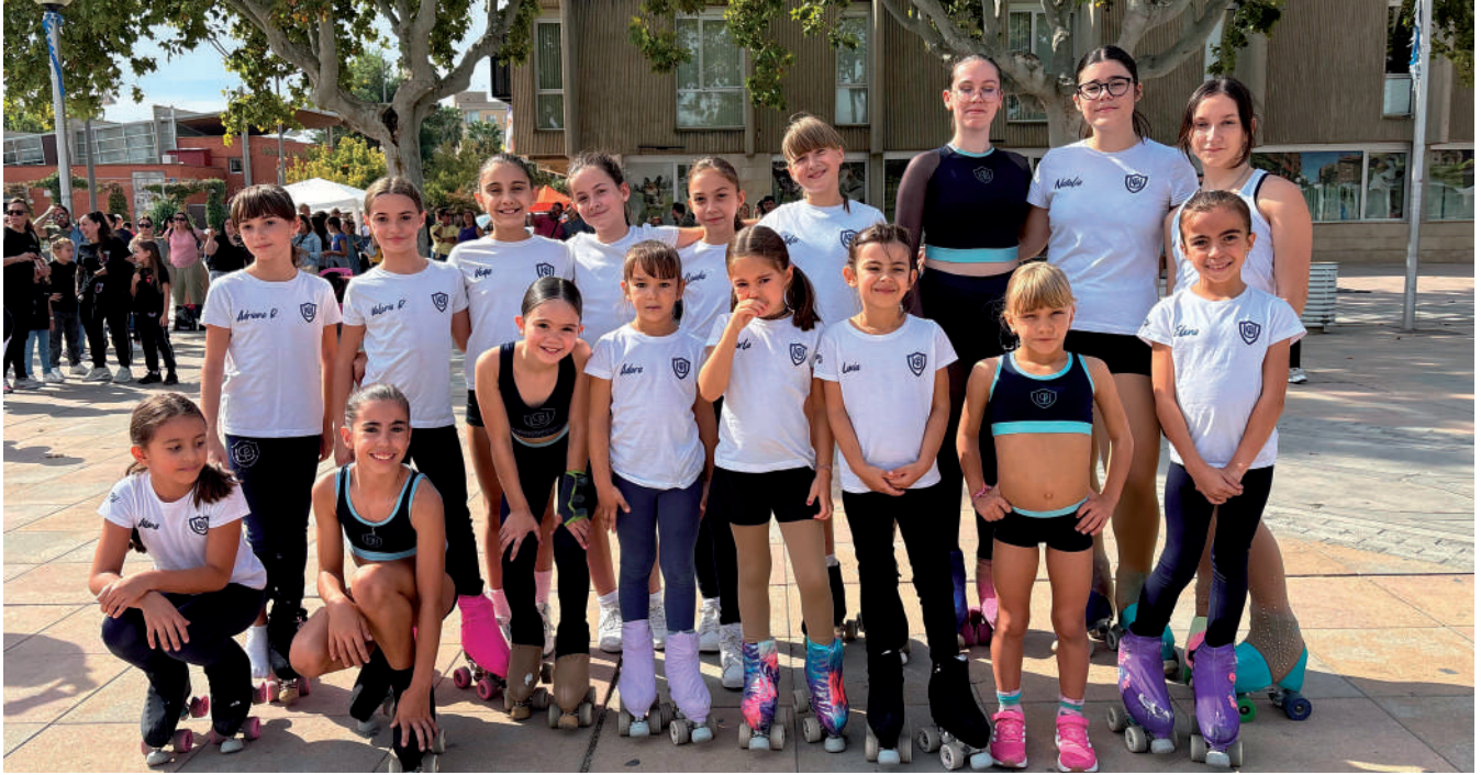
Fotografía: El Club Patín Utebo no quiso perderse la fiesta con sus jóvenes integrantes.

D el 23 al 30 de septiembre, Utebo celebró con entusiasmo la Semana Europea del Deporte, un evento que transformó el municipio en un gran escenario de actividad física, convivencia y promoción de estilos de vida saludables. Durante esos días, vecinos de todas las edades participaron en un extenso programa de competencias, talleres, exhibiciones y jornadas de puertas abiertas en los espacios deportivos, escolares y públicos del municipio.