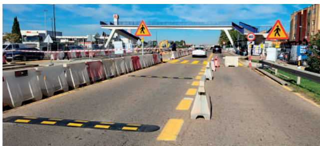
Fotografía: Las obras avanzan a buen ritmo y cumpliendo los plazos.

A mediados de noviembre está prevista la demolición, en dos fases, del puente del Alcampo, una intervención que se prolongará hasta febrero. Durante este periodo, la ave-