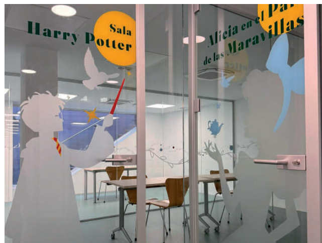
Fotografía: Nuevas salas polivalentes en el sótano de la Biblioteca.