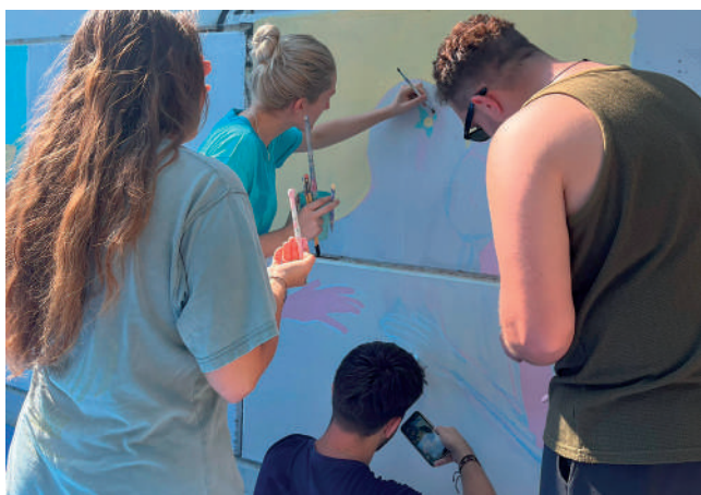
Fotografía: El mural recuerda el papel que la juventud desempeña en la transición ecológica.

La Concejalía de Juventud del Ayuntamiento de Utebo, con el apoyo de la Comarca Central de Zaragoza, ha clausurado la cuarta edición de You ART ME, proyecto Erasmus+ organizado por Viaje a la Sostenibilidad. Durante varios días, jóvenes de Portugal, Italia, Ucrania,