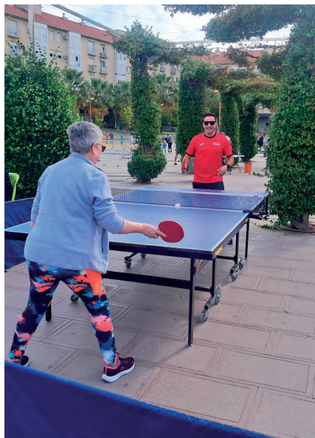
Fotografía: Deportes para todas las edades y gustos.

Desde el Ayuntamiento, se buscó acercar el deporte a toda la ciudadanía y reforzar el mensaje de que mantenerse activo es clave para una vida saludable. Larraz recordó que la feria, ya consolidada en su cuarta edición, nació con ilusión y ha ido creciendo gracias al esfuerzo conjunto de clubes, escuelas, gimnasios y entidades locales, hasta convertirse en un referente en Aragón.