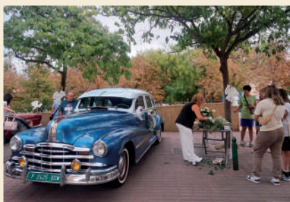
Fotografía: La alta participación de comercios, bares y vecinos avala el éxito de esta edición.

locales, acompañados de propuestas culturales y artísticas. El resultado fue un éxito porque logró convocar a un numeroso público en la calle que contempló cómo el comercio local mostró todo su empuje y su vitalidad. En pocas palabras, hizo posible que el pequeño negocio de Utebo se hiciera presente y visible a toda la comunidad.