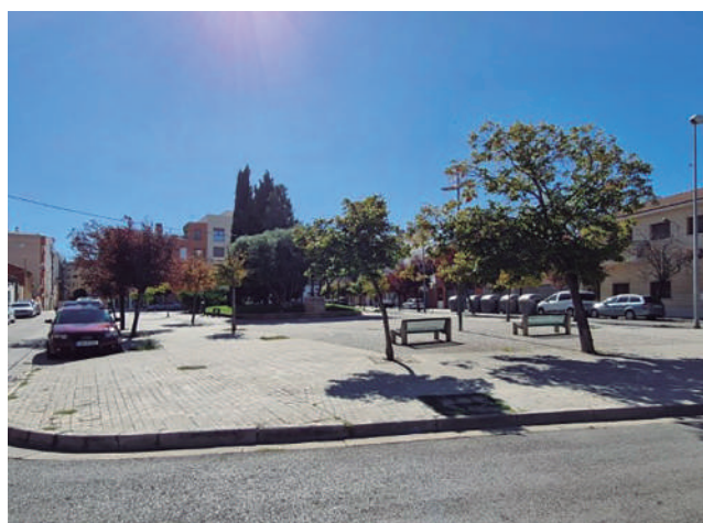
Fotografía: Plaza Plaisance du Touch sin renovar.

La intervención supondrá una reconfiguración del espacio público, actuando sobre la zona peatonal para ganar el espacio necesario para los nuevos aparcamientos. Además, el proyecto incluye la renovación completa del