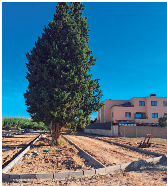
Fotografía: Obras en el Camino de la Estación.

Con estas tres actuaciones, el Ayuntamiento de Utebo reafirma su compromiso con la mejora continua del entorno urbano y la movilidad. La creación de nuevas plazas de aparcamiento, la modernización de infraestructuras y la recuperación de espacios públicos son pasos firmes hacia un municipio más ordenado, accesible y pensado para las personas. Avanzamos así hacia un modelo de ciudad más cómoda y sostenible, donde la planificación urbanística responde a las necesidades reales.