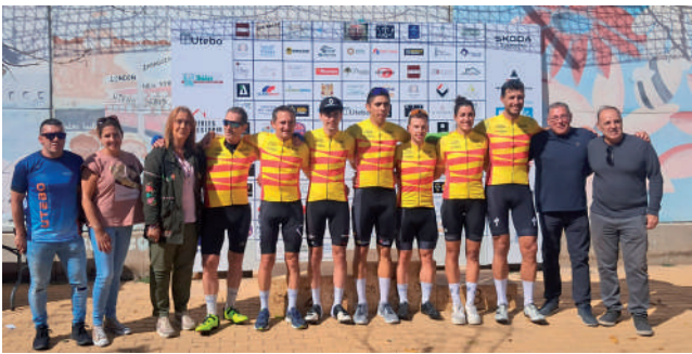
Fotografía: Utebo acogió el X Criterium Utebo y el II Criterium Fémimas Skoda Zaratecno

Utebo se convierte en el epicentro del ciclismo aragonés con la final de la Copa Aragón Criterium 2025, celebrando el X Criterium Utebo y el II Criterium Fémimas Skoda Zaratecno. El evento, organizado por el Club Ciclista Utebo y patrocinado por el Ayuntamiento de Utebo, puso a la localidad en el centro de la competición, reuniendo a ciclistas y aficionados para vivir una jornada llena de deporte, emoción y ambiente competitivo en las calles de nuestra localidad.