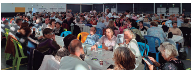
Fotografía: El 5 de octubre en Utebo celebramos el Día del mayor