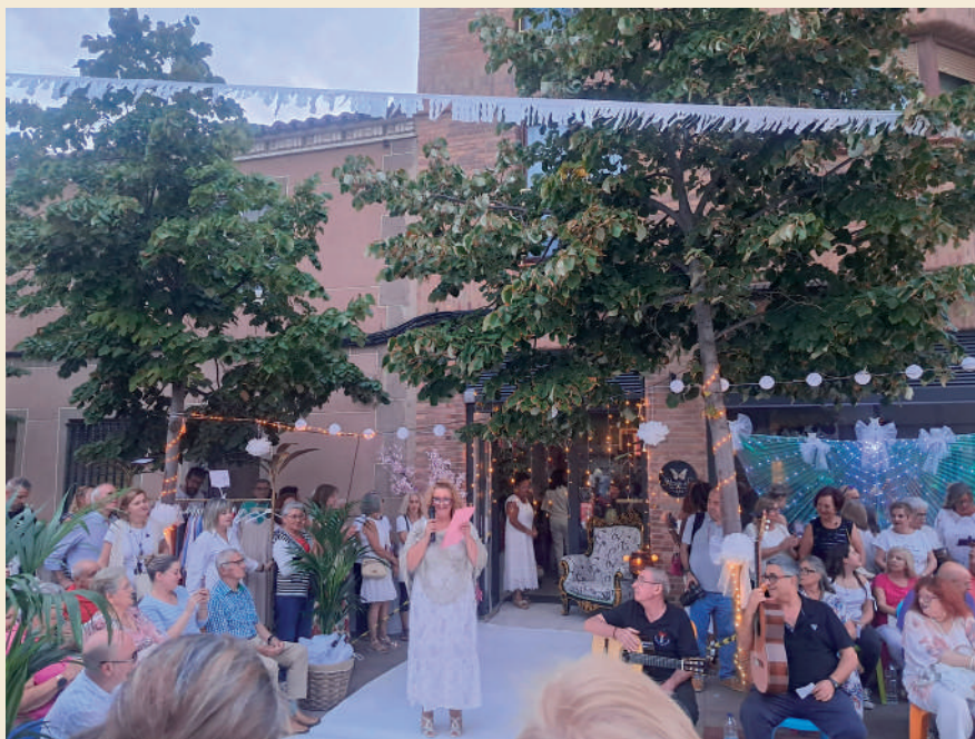
Fotografía: Música, catas, sorteos y hasta un desfile de moda en la Noche en Blanco.

La Noche en Blanco fue una fiesta por todo lo alto, que contó con multitud de actividades. Desde un desfile de moda hasta degustación de productos