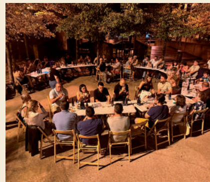
Fotografía: La cata de cervezas contó con una enorme participación.

Sin duda, el gran ambiente, la alta participación y la implicación de los comercios y bares, y de todos los vecinos que acudieron al evento, avalan el éxito de esta edición.