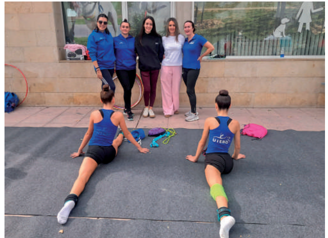
Fotografía: La Plaza de la Constitución se convirtió en un gran gimnasio al aire libre.