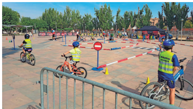
Fotografía: Educación vial para los más pequeños.