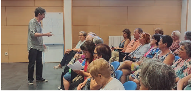
Fotografía: Presentación del Programa de Envejecimiento Activo 2025-2026.