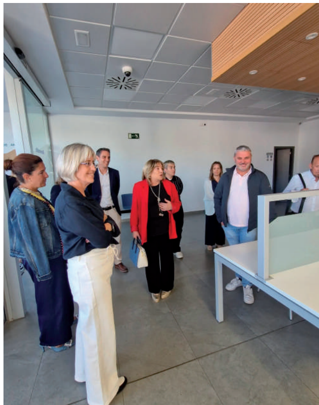
Fotografía: La consejera de Educación y Cultura del Gobierno de Aragón alabó la apuesta por la cultura en Utebo.

pero también opositores o alumnos de máster), esta infraestructura cuenta ya con más de 200 usuarios.