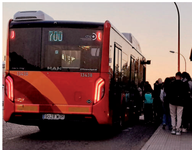
Fotografía: Estudiantes en la Línea 700.