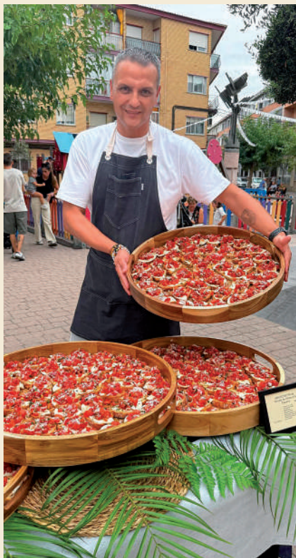
Fotografía: El tomate de Utebo, en forma de gazpacho, brocheta de tomate a la toscana y también de trenza, causó sensación entre los asistentes.

La velada contó además con una variada programación cultural y artística que convirtió la experiencia de compra en una auténtica fiesta. Entre las propuestas destacaron el desfile de moda de Alas de Mariposa, la exhibición floral sobre un vehículo clásico de Bensiflor, el encuentro de coches clásicos, los talleres creativos con luces fluorescentes, así como conciertos en directo como el de Del Toro Blues Trío.