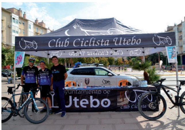
Fotografía: Clubes, escuelas, gimnasios y entidades locales fueron claves en el éxito de la IV Feria del Deporte.

En el ámbito competitivo, sobresalió el partido de baloncesto U22 entre el filial del Casademont y el Peñas Huesca, que se disputó el miércoles 24 a las 17:30 horas en el Palacio de los Deportes.