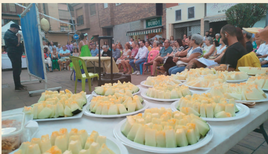
Fotografía: El Melón de Torres estuvo presente en la Noche en Blanco.