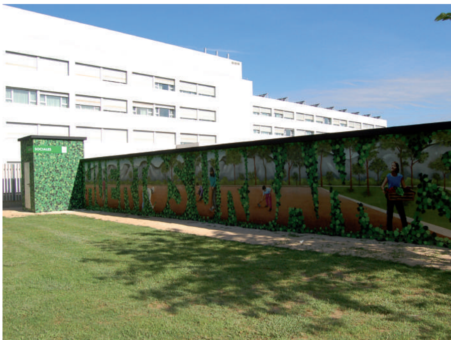
Huerto urbano en el Parque de Las Fuentes, junto a la residencia.

LOS DOS ESPACIOS DISPONIBLES, UNO EN EL PARQUE DE LAS FUENTES Y OTRO EN LA CALLE DINAMARCA, SE PUEDEN USAR POR LOS VECINOS PARA LA PRÁCTICA DE LA HORTICULTURA