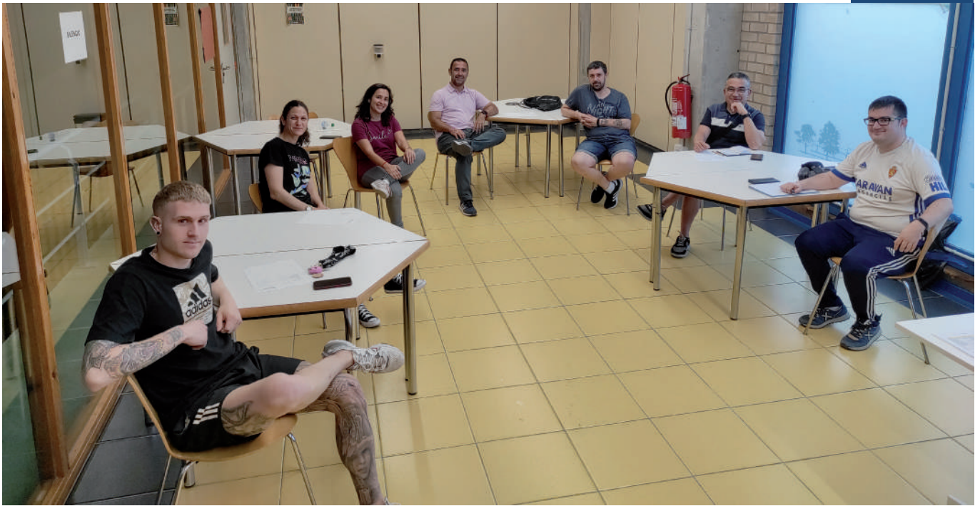
Voluntarios de las Fiestas de Utebo en una reunión de trabajo.