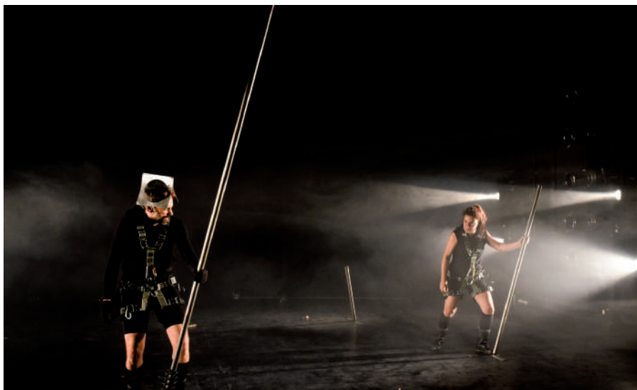
Producción de "Magallanes y Elcano".