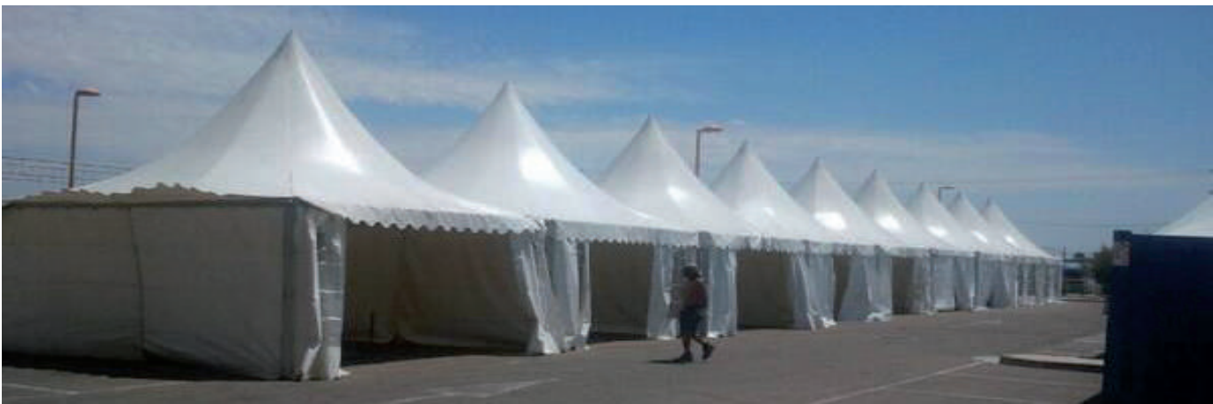
Jaimas para las peñas.

En Malpica, para San Juan ha sido elegido como pregonero de las fiestas la empresa Chocolates Lacasa.