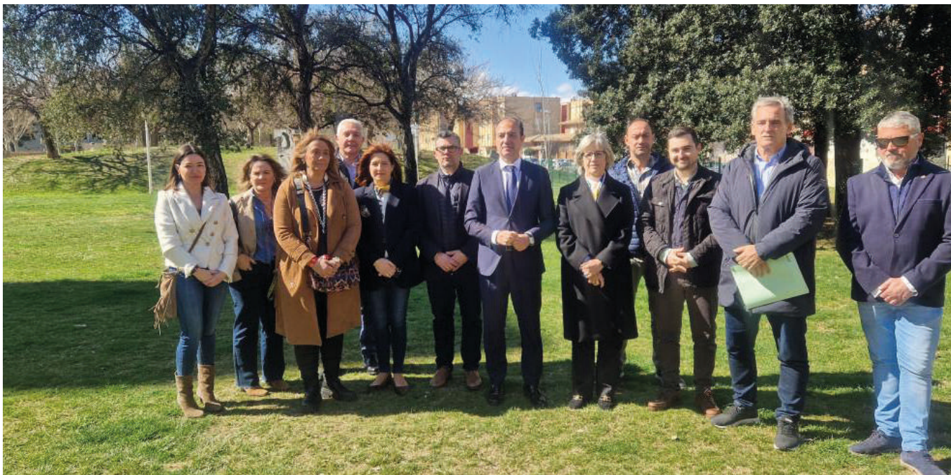
El equipo de gobierno del Ayuntamiento de Utebo, con el consejero de Sanidad y la alcaldesa de Utebo, en el centro de la imagen, en el terreno de la calle Tenerife donde se construirá el nuevo centro de salud de la localidad.