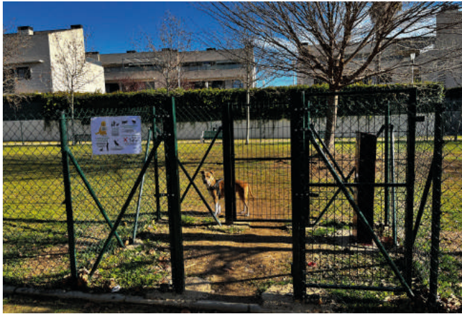
2.- Paseo Alborada. Situado al final del Paseo Alborada es uno de los nuevos parques caninos de Utebo