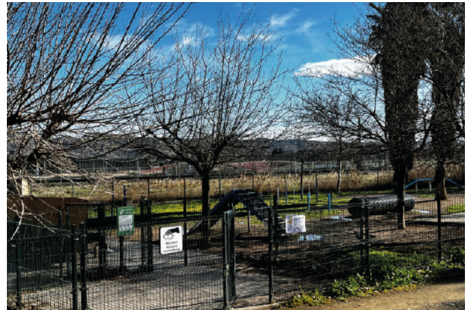
1.- Parque Las Fuentes.

Hay que destacar que estos parques son zonas específicas valladas donde los perros, acompañados de sus