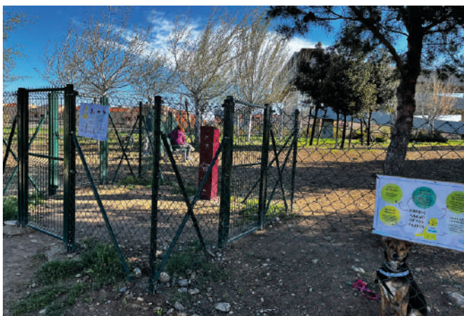
6.- Parque Los Prados Se ubica en la zona más cercana a la pasarela peatonal de dicho parque.

lidades. Es importante por otro lado respetar las normas de uso de dichas instalaciones tales como: recoger las heces, vigilar al perro para que no moleste a otros perros ni a personas... Además, puesto que la salud tanto de las mascotas como de sus dueños es un tema muy importante debe asegurarse la vacunación y su desparasitación para prevenir la propagación de enfermedades.