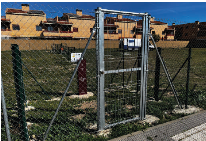
4.- Parque del Camino de la Estación Puerta doble. Además, en dos de estas instalaciones, en la del Parque de Los Prados y en esta del Camino de La Estación, se