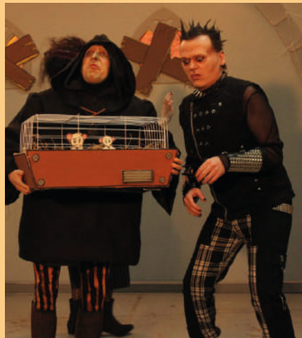
"My Funny Frankenstein".

La compañía aragonesa El Mar del Norte utiliza la técnica del Teatro-foro. Tras representar una breve escena teatral, se nos permite debatir y hablar para cambiar la historia, modificando la conducta de algunos personajes, al mismo tiempo que reflexionamos sobre nuestro posible papel en una situación similar. El lema de esta campaña es "Si no te gusta