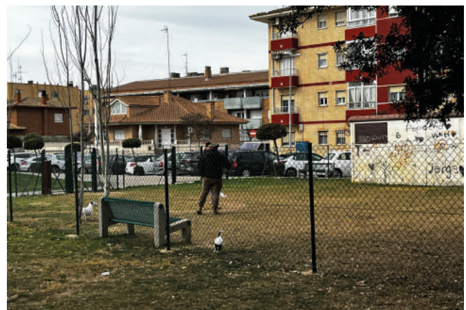
5.- Parque Europa

Cuenta con dos zonas bien diferenciadas y separadas de agility y de esparcimiento.