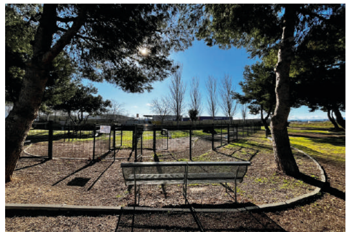
3.- Parque calle Dinamarca

El más veterano ya que lleva ya abierto varios años. Cuenta con dos zonas diferenciadas: la de esparcimiento y la de agility