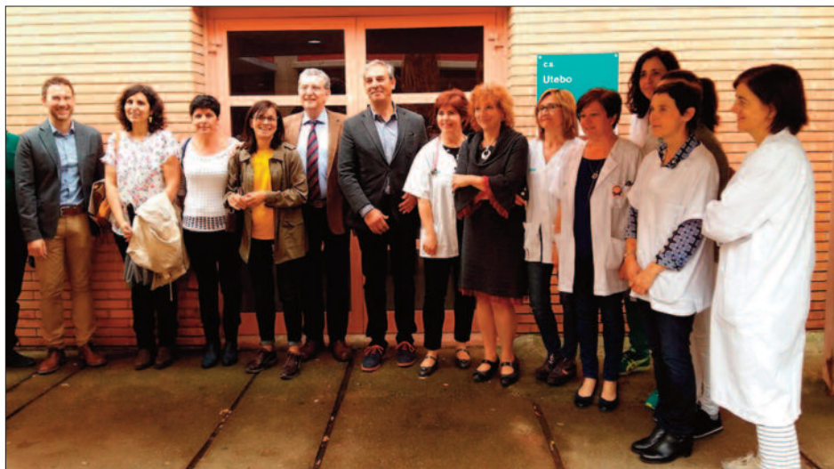
Sebastián Celaya (en el centro, con corbata) junto a Miguel Dalmau, alcalde de Utebo, la concejala de Salud del Ayuntamiento, Rosa Magallón (con vestido negro) y parte del equipo de profesionales del Centro de Salud.

E L CONSEJERO DE SANIDAD, Sebastián Celaya, visitó, el pasado lunes 28 de mayo, el centro de salud de Utebo, en el que se viene desarrollando -en colaboración con el propio consistorio- un programa denominado Estrategia de Atención Comunitaria para abordar el sobrepeso infantil. Celaya comenzó su visita en la casa consistorial, donde mantuvo una reunión con el alcalde, Miguel Dalmau, para posteriormente visitar el centro de salud.