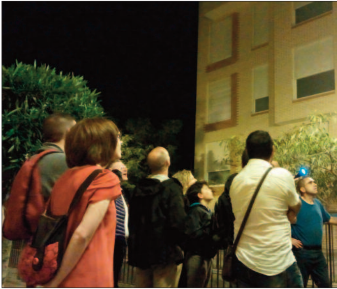
Un momento de la salida en colaboración con la Sociedad Española para la conservación y estudio de los murciélagos.