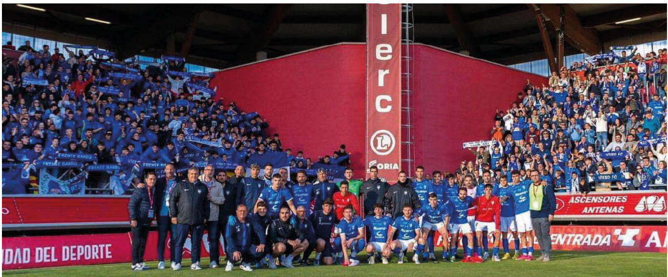
El equipo, directiva y afición, en el campo del Numancia, donde el Utebo jugó la vuelta del play off de ascenso.

El Utebo FC quiere más socios y también necesita un espacio donde poder entrenar. Ahora son 400 los chicos y chicas de la cantera y hay 125 en espera. “Estamos buscando en el entorno de Utebo otras instalaciones donde poder dar cabida a todos porque están llegando desde Pinseque, Casetas, Monzalbarba... e incluso están volviendo algunos futbolistas que estaban jugando fuera”, afirma Orcajo. Y, por encima de todo, el club quiere ir poco a poco para estar presente en las categorías más altas del fútbol base aragonés.