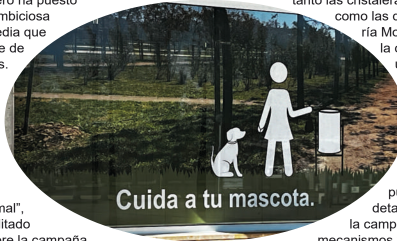
Imagen de la campaña para concienciar a todos de la necesidad de cuidar a tu mascota

El consistorio utebero ha puesto en marcha una ambiciosa campaña multimedia que aboga por un Utebo libre de heces y orines de perros. Las cristaleras de la Casa Consistorial y del Centro Cultural María Moliner han sido viniladas con imágenes de la campaña y se ha editado un vídeo en colaboración con la protectora “Sonrisa Animal”, así como que se han editado folletos informativos sobre la campaña, cartelería específica y banderolas de concienciación en las farolas.