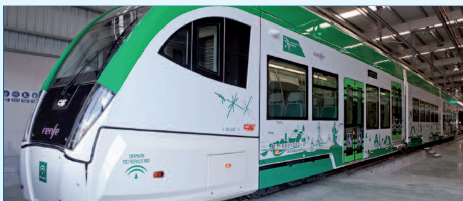
Imagen de tren-tram, un medio de transporte que puede prestar servicio no sólo en las líneas de tranvía sino también con las líneas de cercanías.

El Consorcio de Transportes del Área de Zaragoza tiene abierto un proceso de encuestas 'online' para conocer la opinión de los ciudadanos de Zaragoza y su entorno sobre la movilidad actual y las necesidades a medio y largo plazo. La encuesta, disponible en la web http://encuestas.consorciozaragoza.es , puede rellenarse hasta el próximo 19 de junio y es anónima, si bien en una primera pestaña se recogen datos sobre el origen y la edad del participante que ayudan a analizar los resultados.