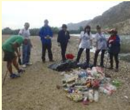
Limpieza del río y el hotel para insectos