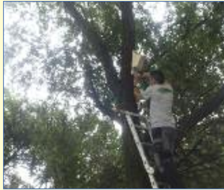
Colocando cajas -nido para murciélagos

El Ayuntamiento de Utebo se sumó a esta iniciativa, la celebración del Día Mundial del Medio Ambiente, hace ya más de diez años, siempre con actividades diversas y con especial hincapié en las dirigidas a los más pequeños.