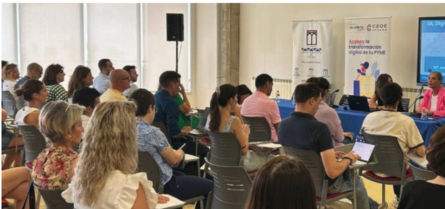
Éxito de la jornada sobre inteligencia artificial.