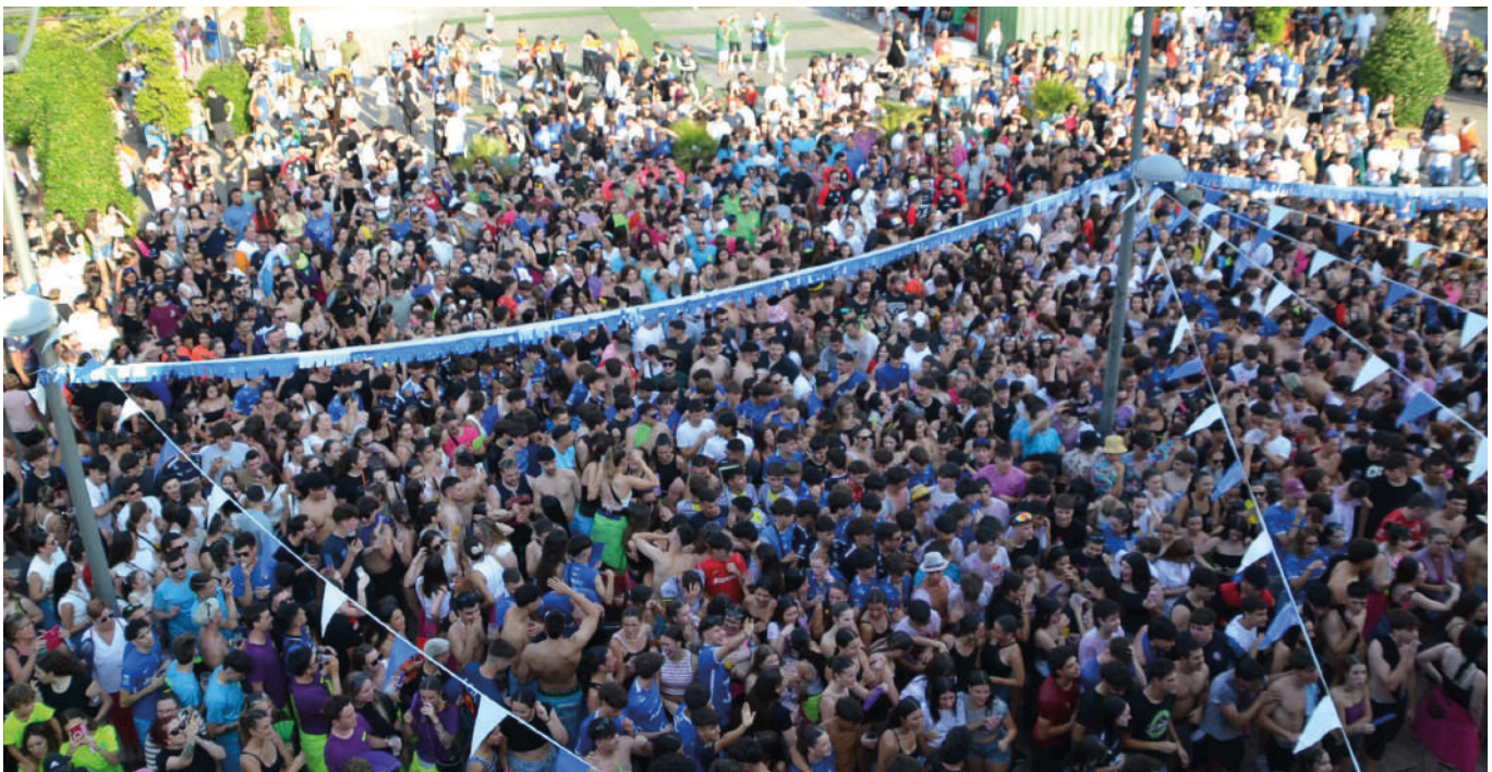
Ambientazo festivo en el pregón, con reparto de rosquillas para todos, desde el Ayuntamiento