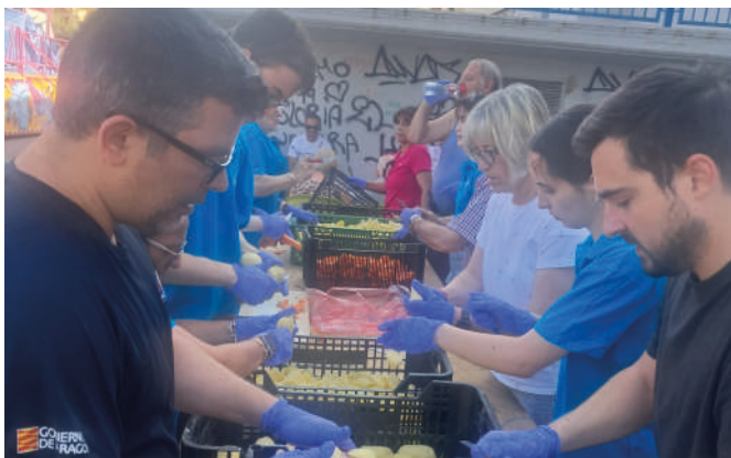
Malpica también celebró sus fiestas de San Juan, con encaje de bolillos y mucha gastronomía. Los representantes municipales echaron una mano para que todo estuviera a punto y muy rico