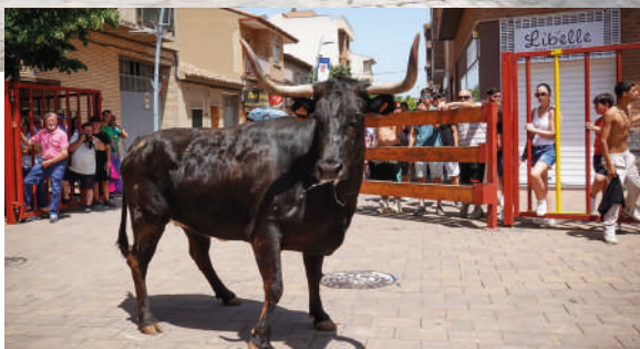
Las vaquillas, arriba y abajo, para todos los gustos y colores, como parte de una tradición de toda la vida. Un festejo que no puede faltar en las fiestas de Utebo