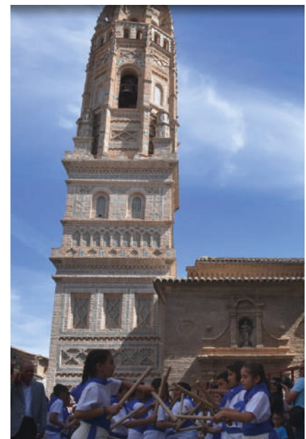
La procesión, el Barbo, el paloteo, el Tragachicos y las vacas, bajo la atenta mirada de la Torre Mudéjar