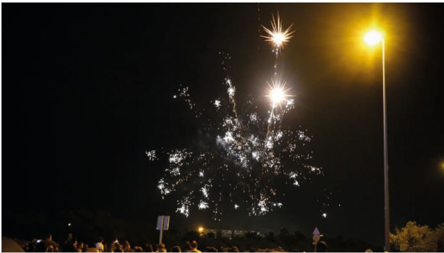
Verbenas, música en todas partes, y fuegos artificiales para celebrar unas fiestas pequeñas, pero únicas también