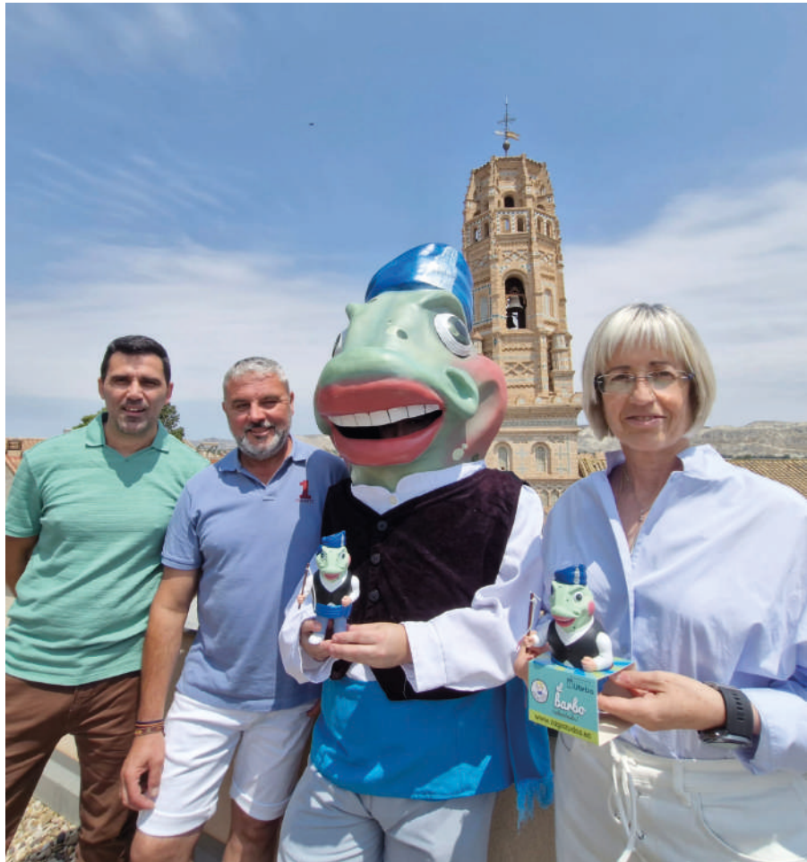
La alcaldesa, junto al concejal de Festejos, el cabezudo El Barbo y su muñeco de goma.

Cintasa, Lujama, Rodenis, Lacasa, Sphere Spain, Alcampo, Ambiseint, Carnicería Ibañez, Cooperativa Santa Ana, Mercadona.