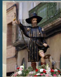
San Roque en procesión

Su altura total es de 8m y su anchura máxima es de 5,2m.