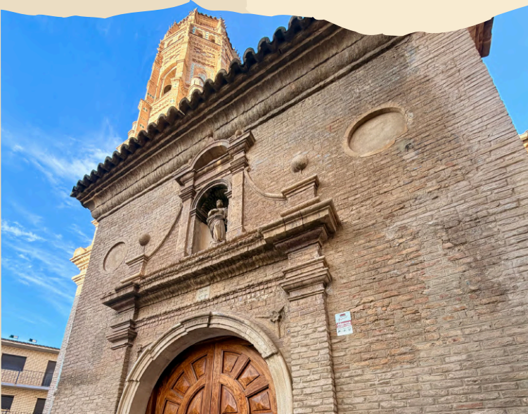
Pórtico de la iglesia.

✧ Época barroca, siglo XVIII: corresponden la cabecera y la portada. La cabecera de la iglesia es de planta de cruz griega.