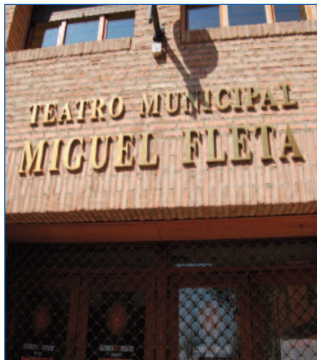
El Teatro Municipal Miguel Fleita será objeto de reforma.